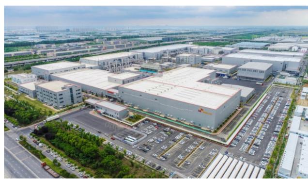
SK动力电池盐城基地