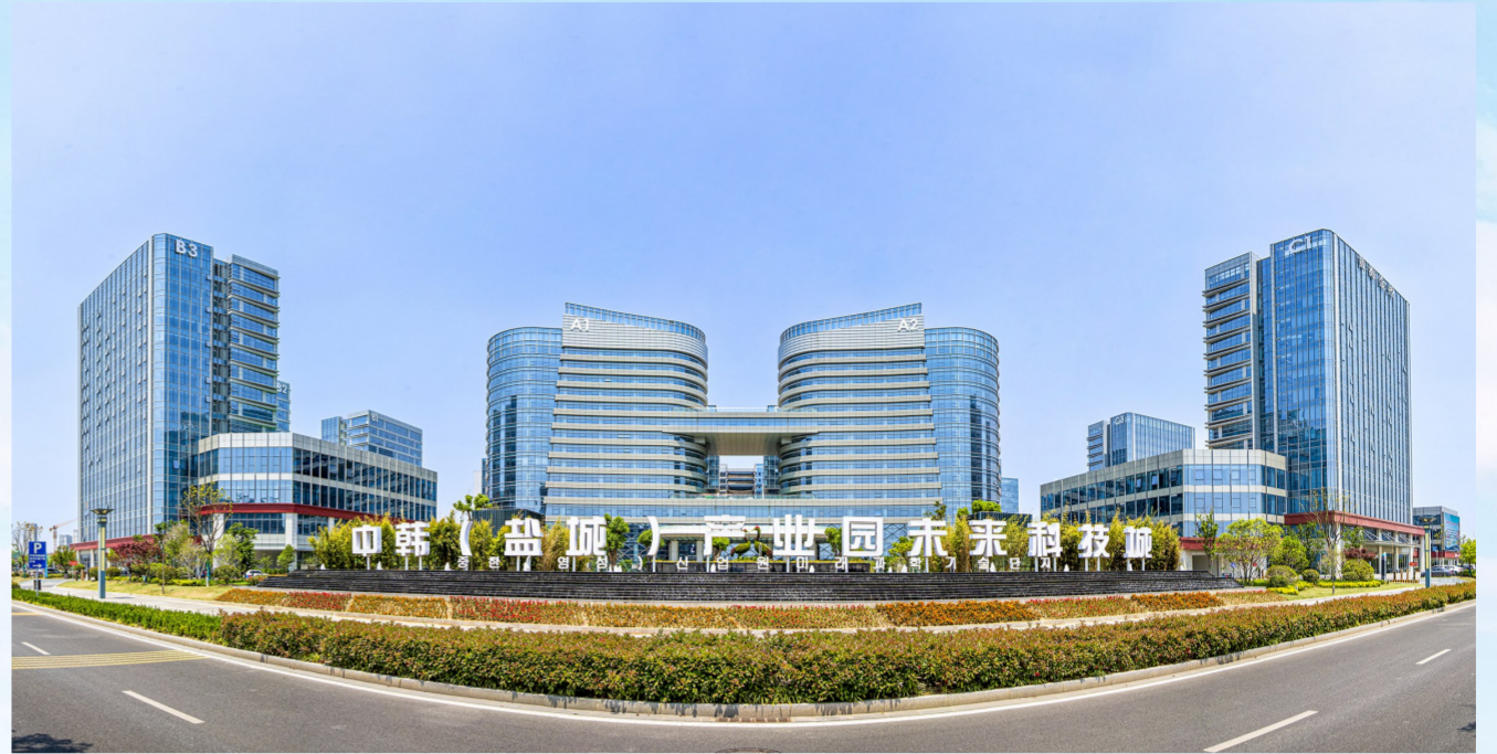
中韩(盐城)产业园未来科技馆