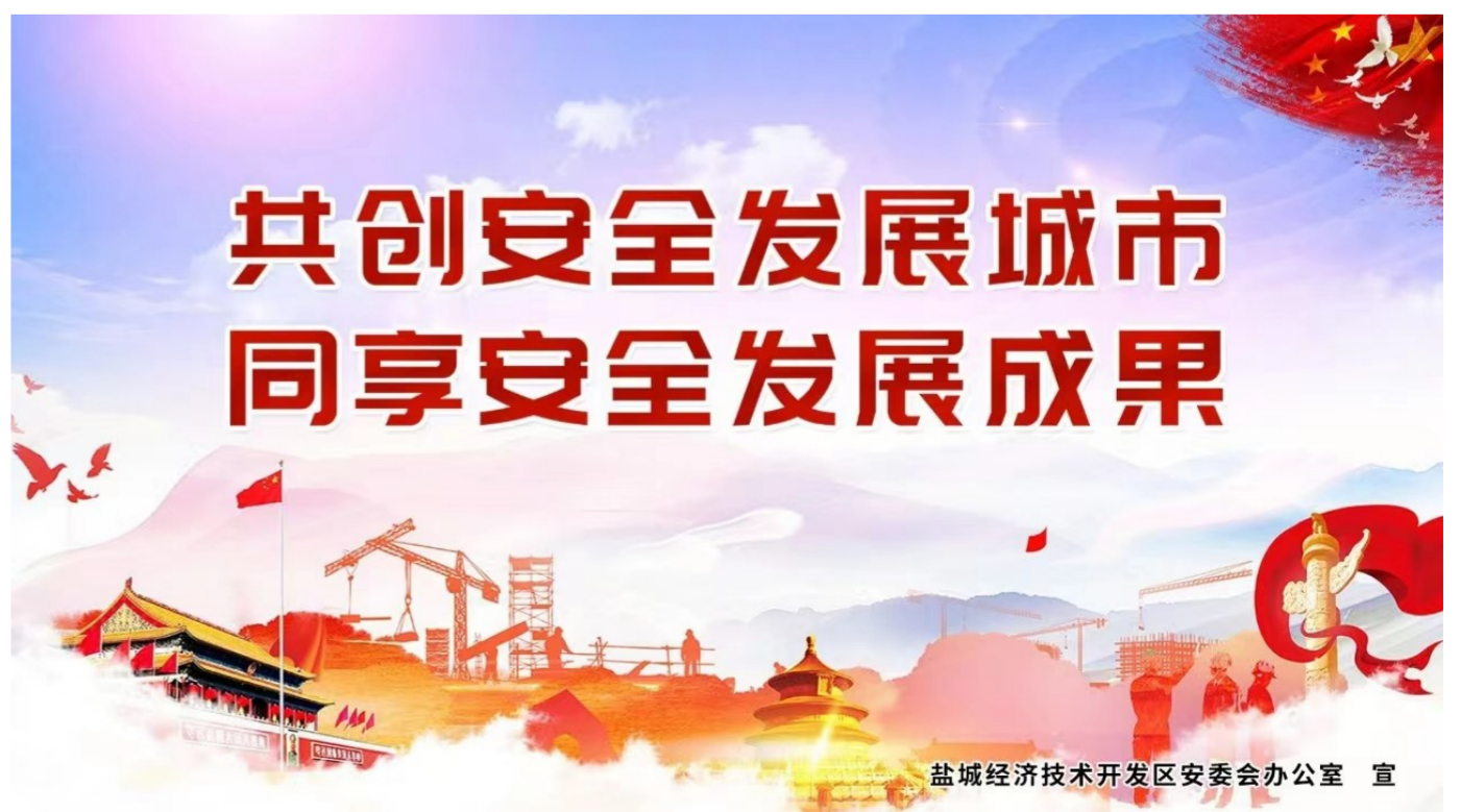
盐城经济技术开发区区委办公室 宣