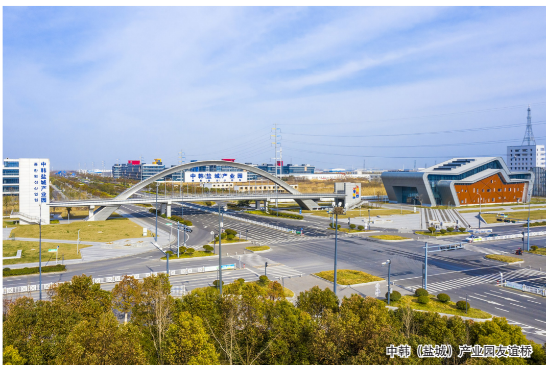
中韩(盐城)产业园友谊桥