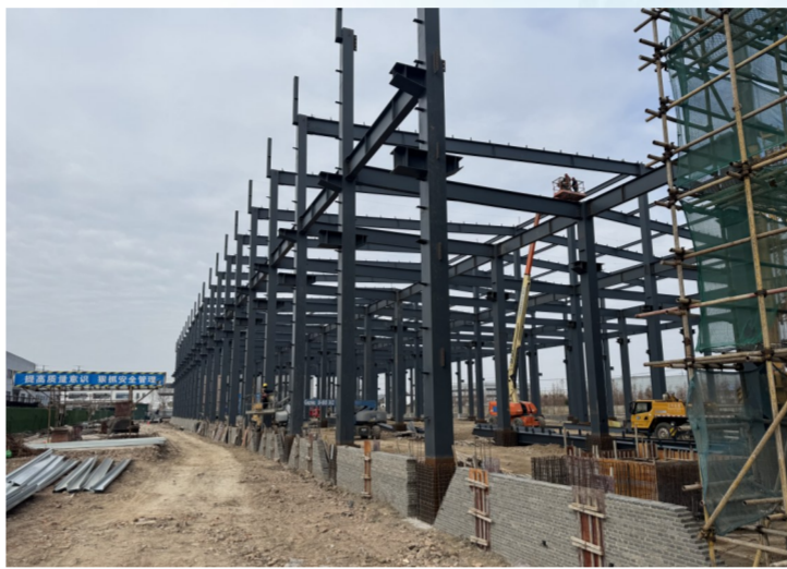
二期项目厂区钢架主体结构施工现场