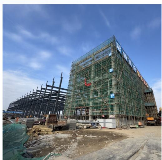
二期项目建设现场

大捷实业凭借技术突破与人才优势逐“新”提“智”，同步扩大产业规模，向存量谋增量、向改革谋效益、向新赛道谋新动能，实现工艺流程“顺、短、快”，工序能力“精、准、全”，为企业高质量发展不断注入强劲动力。