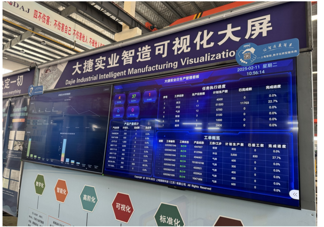
生产车间实时数据显示