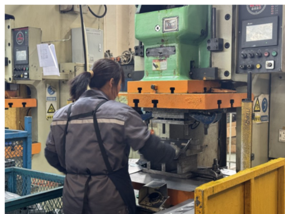
汽车座椅零部件冲压作业