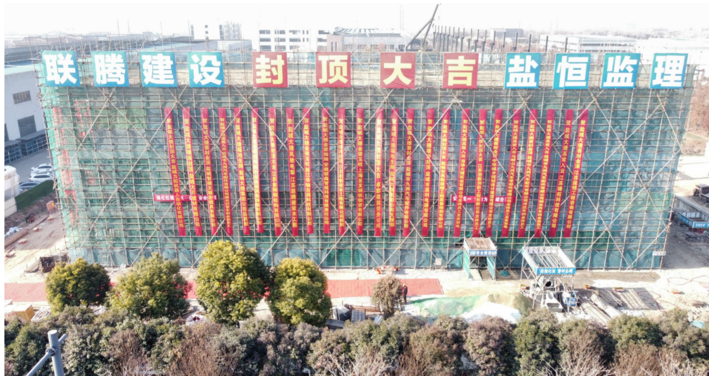
办公楼主体项目建设现场