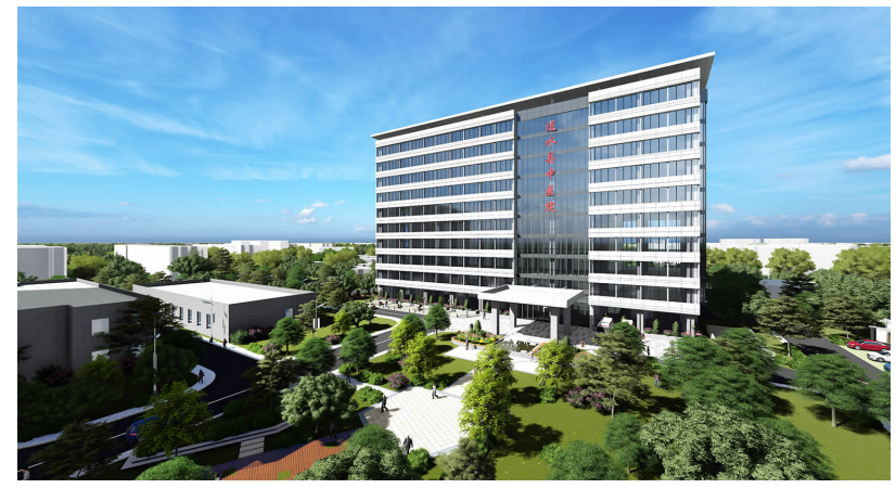
新建病房楼效果图