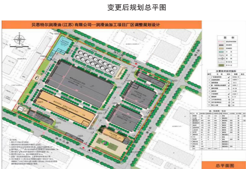
变更后规划总平面图

贝思特尔润滑油加工项目位于经济开发区经一路西侧、纬十三路北侧,用地性质为工业用地,由贝思特尔润滑油(江苏)有限公司建设,原方案于2022年5月审定通过,变更方案由浙江经纬工程设计有限公司和山东鸿运工程设计有限公司联合设计。