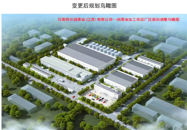
变更后规划鸟瞰图