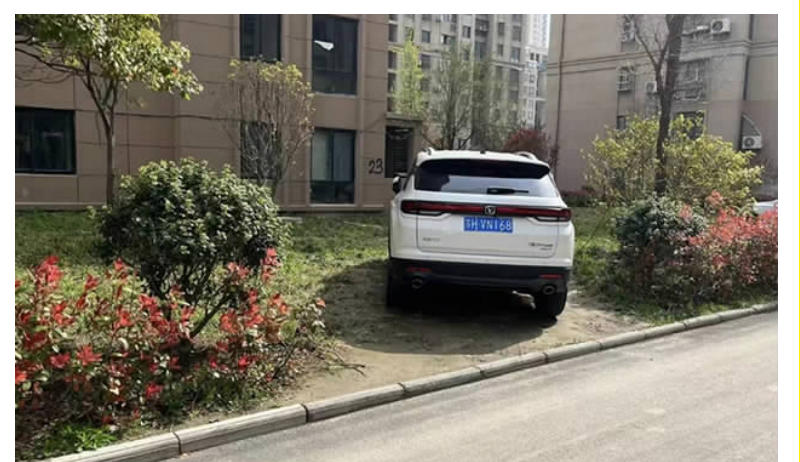
在开元名都小区内,不文明停车现象严重,绿化带普遍遭到破坏。