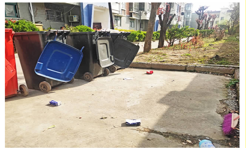
在中恒国际新城小区内,垃圾桶边上不少生活垃圾散落在地,影响美观。