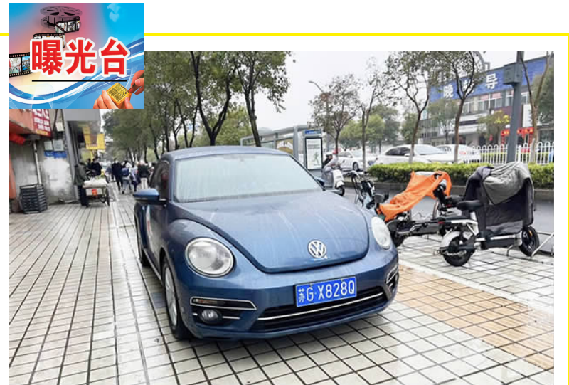
在安东路人行道上,有机动车辆乱停乱放。