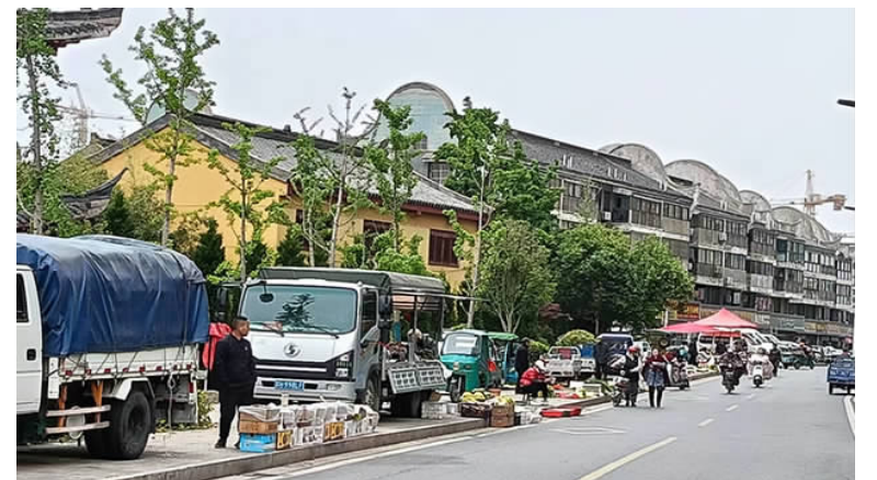
在环湖北路,有很多流动摊点在路边摆放,并产生较多垃圾。