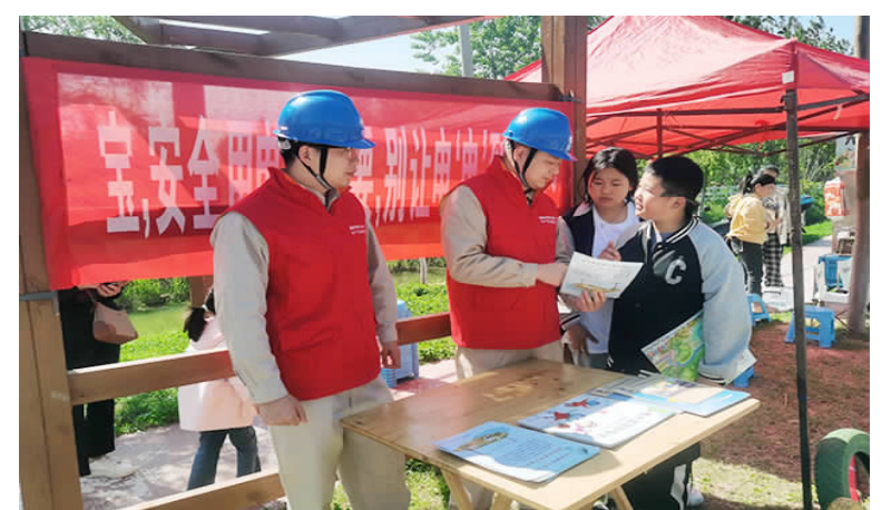
“五一”期间,保滩街道周集村农家乐景区,国网江苏电力涟水红日共产党员服务队队员向游客讲解安全用电常识,并开展线路巡查,以保障假日期间景区用电安全稳定。

涓涓细流汇成江海。几年来,县慈善总会所收善款上千万元,挽救了许多患者的生命,帮助了很多儿童重返校园,一批又一批困难家庭学生圆了大学梦,为很多处于困境中的人送去了党和政府的温暖。凡受助的人永远记住这些不留姓名的捐款人的爱心善举,也呼吁社会各界为他们点赞,同时将善举传递下去,为爱接力,成为爱的播撒者,营造“人人可慈善,人人皆慈善”的浓厚氛围,让涟水成为一座充满善良与爱心的城市。