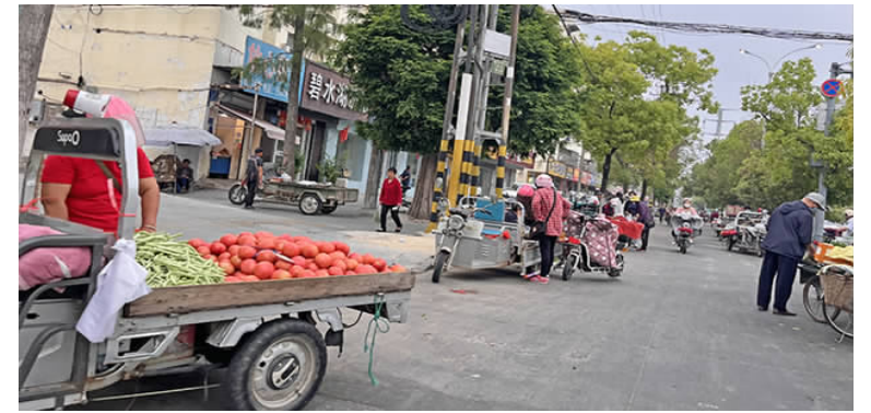
在金城路与北大街交叉口，部分摊主在人行道占道经营。