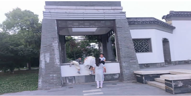
端午假期，我县各旅游景区游客络绎不绝，旅游市场呈现一片繁荣景象，文明、礼让出行已成为越来越多民众自觉遵守的行为规范，但仍有个别游客存在不文明行为，让原本美好的景色多了几分瑕疵。图为几名儿童在攀爬景区公共设施。