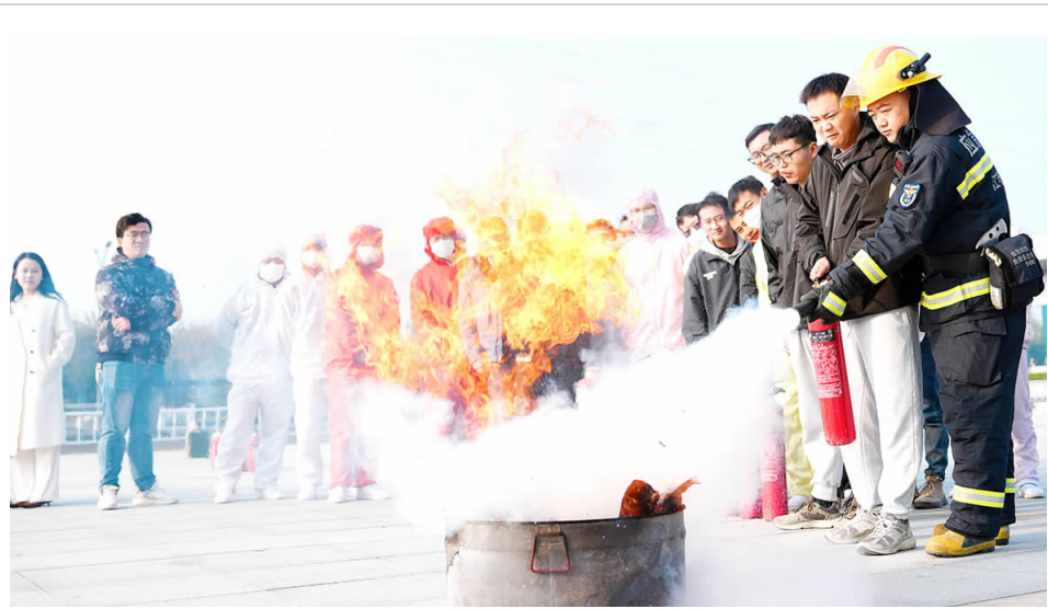
日前,县消防救援大队深入淮安捷泰新能源科技有限公司,开展应急演练及消防宣传,通过坚持主动作为、强化服务指导的工作理念,将“消防课堂”搬进企业,牢固树立企业职工消防安全意识,为企业员工“充电”,切实提高消防安全管理工作能力。