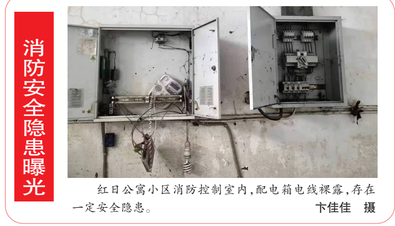
红日公寓小区消防控制室内,配电箱电线裸露,存在一定安全隐患。