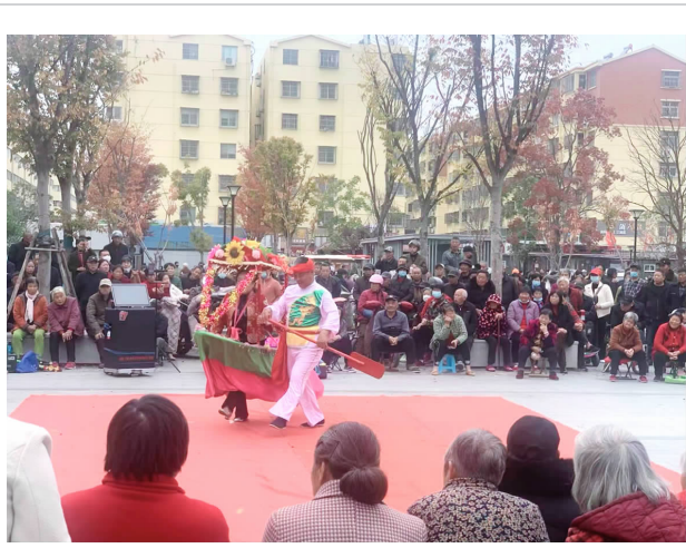
近年来,我县积极推动社区文化建设,以文体活动为纽带,融合市民教育、新时代文明实践志愿服务等多个领域,形成了强劲的社区文化发展态势,为居民带来丰富多彩的文化生活体验。图为军民社区文化广场的文化演出多影。