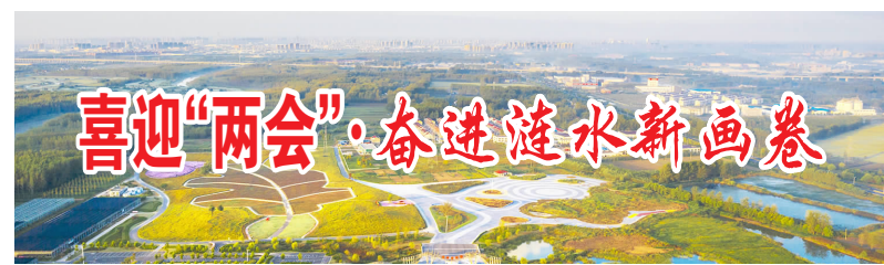
喜迎“两会”,奋进涟水新画卷

从吃饱穿暖,到更稳定的工作、更满意的收入、更可靠的社会保障……“十三五”期间,不断跳动的数字,持续刷新的排名,越来越多的获得感、幸福感、安全感让百姓感受到了生活的变迁。