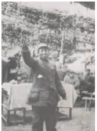
华中野战军政治委员谭震林在陈师庵会议上作形势报告