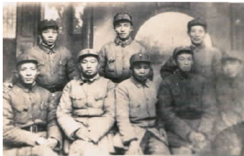
华中野战军部分领导人合影:后排右起:粟裕、钟期光、张震,前排右起:唐亮、王必成等