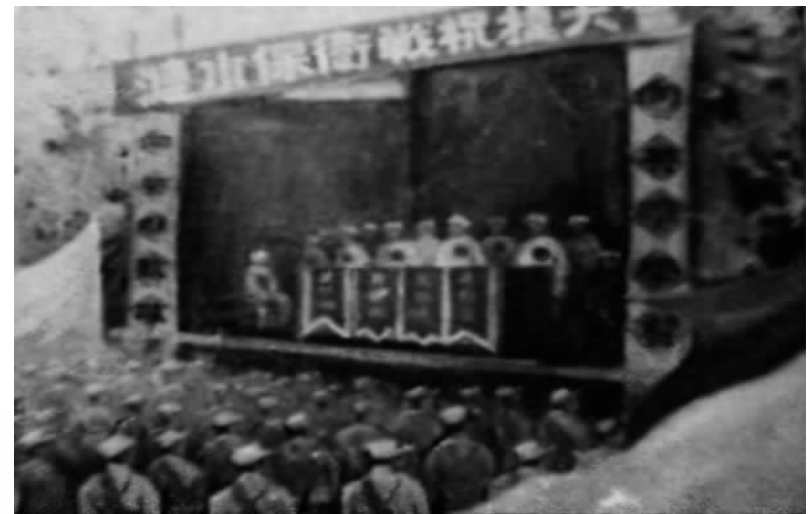
涟水保卫战胜利大会