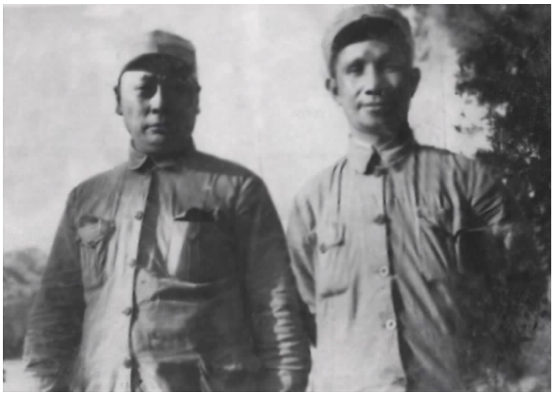
涟水保卫战时陈毅、粟裕在涟水