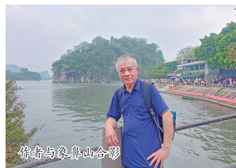
作者与象鼻山合影

新中国成立后,姜氏药铺并入公私合营的中药厂,开始大批生产姜氏珍宝膏。后来,全国一些药厂也依据这药膏的配方来生产,渐渐地改称为“伤湿止痛膏”。(郭旭光)