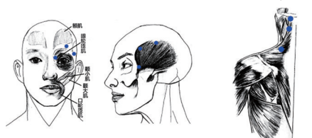
眼周围神经麻痹症多好发于眼轮匝肌、额肌、颞肌