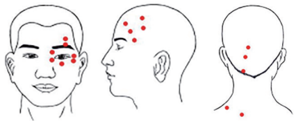
额面经筋筋结病灶图 颞筋区经筋筋结病灶图 眼周围神经麻痹足太阳经筋枕颈区好发筋结病灶图