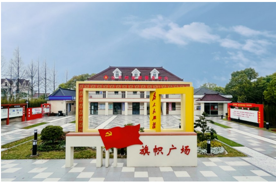
上海市乡村振兴示范村——公平村。