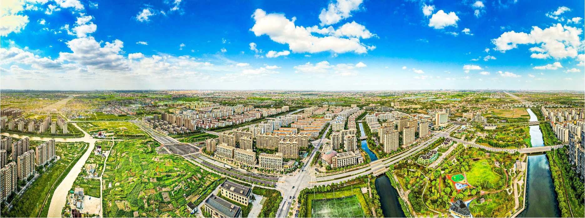
泥城已发展为产城乡一体化发展的现代城市。

这里，有“两区叠加新高地、产城融合新标杆”的宏大发展目标；这里，有“一轴三区”的明晰发展格局；这里，有新能源汽车、集成电路、高端装备制造等众多前沿产业；这里，有“推窗见绿色，漫步在林中”的闲适生活；这里，有“一条大芦线，十里风光带”的壮阔乡村景色。这里，就是正在蓬勃发展的浦东新区泥城镇。当时代洪流和发展浪潮裹挟而来，曾经升起浦东第一面革命红旗的泥城，毫不犹豫抓住发展契机，开始了一场时不我待的“加速跑”。 从2004年到2024年，历经20年的开发建设，泥城镇已经从一个寂寂无名的偏远小镇，成长为产业强劲、社会民生持续改善、产城乡一体化发展的现代城市。20年光阴，一系列的变化在这片土地上发生着。 ■本版文字 记者 陈烁 ►“一条大芦线，十里风光带”的乡村图景。 “泥城动能”愈发强劲 泥城镇拥有浦东新区引领区、自贸试验区临港新片区两区叠加优势，产业动能强劲。在镇域内，有镇属工业园区、琥珀园、明珠园、玛瑙园、智芯园、新科园、新侨园等一众园区，为产业项目提供充足的发展空间，迎接一个个产业项目落地。 每天，超过3200辆新能源汽车在这里下线，带动形成了完整的汽车产业链，泥城新能源汽车产业集群初具规模。截至目前，泥城镇域内共有汽车相关企业29家，涵盖了电机电控、汽车电子、常规部件、内外饰、换电服务、汽车零部件再制造等企业，形成了产业链供应链高度协同、产业链创新链双向融合的产业生态圈。 2023年，全镇汽车及零配件制造产业规上产值占总规上工业产值的73.17%。 除新能源汽车外，集成电路、高端装备制造等产业在泥城也有一定规模的集聚度。上海市特色园区“东方芯港”一区就在泥城，汇集了积塔半导体、新昇半导体等集成电路上下游企业15家。同时，随着城地启斯云计算、国奥源华安生物科技等企业落户泥城，数字经济、算力产业、生物医药、氢能等前沿产业领域在泥城也崭露头角。 工业产业蓬勃发展，随着乡村振兴的推进，泥城的农业产业也一样红红火火。 青扁豆产业不仅是泥城的一个特色产业，更是农产品地理标志产品。在红刚青扁豆合作社这一“领头羊”的带领下，泥城镇青扁豆种植总面积达4700亩，总产量约18800吨，总产值近两亿元，带动了大批