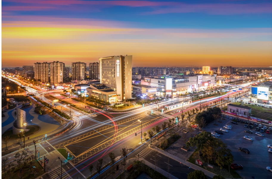
泥城镇主轴线鸿音路璀璨夜景。

农民致富。 泥城镇公平村成功创建红色美丽乡村、上海市乡村振兴示范村；人民村、海关村成功创建上海市美丽乡村示范村。现在，正在分步实施6个保留村的乡村振兴示范村创建工作，依托大芦线地理优势，打造“六村联动”的乡村振兴示范区，呈现“一条大芦线，十里风光带”的图景。 在这些基础上，泥城镇以“农文旅”为抓手，努力推动乡村产业、文化与旅游深度融合，探索乡村振兴产业造血机制。引进企业推进“乡悦·南泥湾”一期工程项目，盘活闲置房舍，利用集体经营性建设用地，打造集民宿餐饮、科研办公、休闲旅游、观光体验为一体的农业产业发展新业态。 为了让这样的动能持续强劲，泥城镇用心用情着力营造良好的营商环境，为企业提供管家式全生命周期服务，通过就业创业、教育医疗等配套服务，形成宜居宜业宜商的创新创业环境。 “泥城温度”持久暖心 产业发展势如长虹，泥城镇人口也随之源源不断导入，泥城迎来了由小镇到现代化城市的蜕变。在推动人民城市建设的道路上，泥城正以城区开发、重大项目、城市更新为突破口，以精深开发促进城区高质量发展、以高品质环境提升人民获得感。 泥城镇的主干道鸿音路两侧，临港宝龙广场、临港万达广场等6个商业项目新次分布，学校、社区卫生中心、养老服务机构、公园绿地镶嵌其中，居民区连接成片，