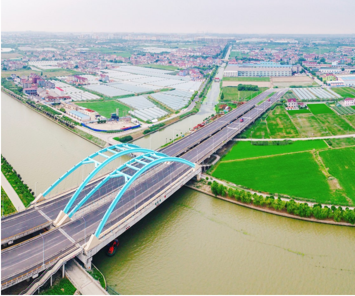
►“一条大芦线，十里风光带”的乡村图景。