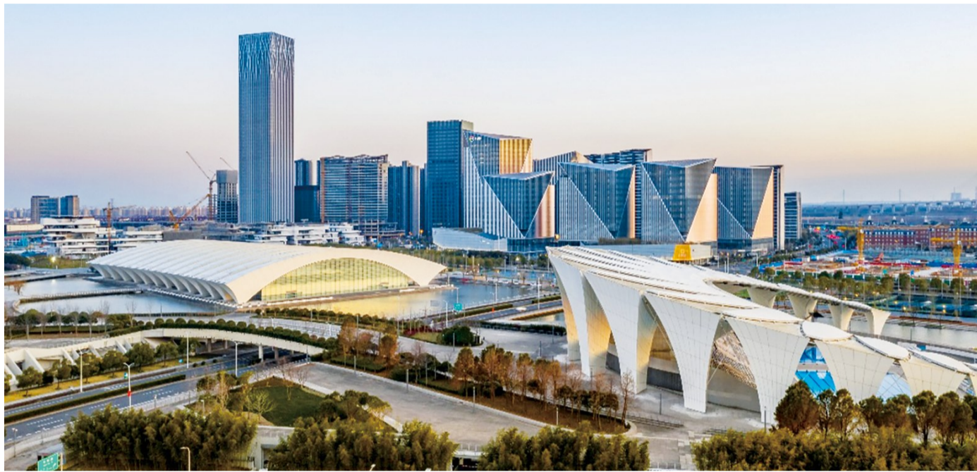
浦东积极推动三星级绿色生态城区试点, 前滩商务区成为全市首批三星级绿色生态示范城区。

目标到2025年, 浦东新区城乡建设绿色低碳体制机制基本建立, 建筑节能水平稳步提升, 绿色生态城区建设持续推进, 重点区域建设实现绿色转型示范引领。超低能耗建筑得到规模化应用, 近零能耗建筑、零能耗建筑和零碳建筑开展试点, 建筑信息模型技术在重点区域、重点建筑得到深度应用, 既有公共建筑节能改造全面推进, 建筑碳排放智慧监管平台初步建成, 可再生能源应用快速发展。到2025年, 浦东新区要累计落实超低能耗建筑示范项目不少于270万平方米, 既有公共建筑节能改造规模不少于300万平方米, 其中节能率达