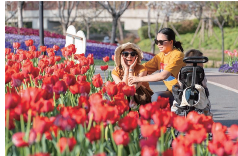
组图：市民走入公园、绿地或街角享受春光。