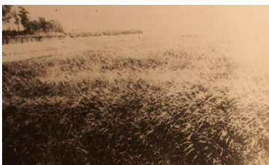
汇角战斗中，28 位指战员壮烈牺牲处。

战斗持续了近 6 个小时，“保卫二中”在弹尽粮绝，背临大海，其他区队无法增援的情况下，28 位战士献出了宝贵的生命，余部走散。12 月 24