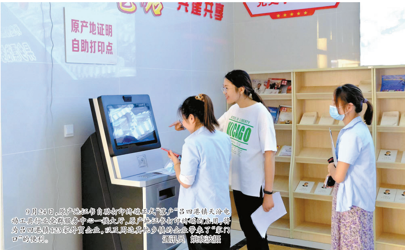
9月24日,原产地证明自助打印终端正式“落户”吕四港镇天汾电动工具行业党群服务中心一楼大厅,原产地证明自助打印终端的启用,将为吕四港镇123家外贸企业,以及周边其他乡镇的企业带来了“家门口”的便利。

本报讯 日前,东珠新村社区开展“爱满金秋日 情暖老人心”志愿服务活动。社区志愿者将慰问品送到老人手上,与老人拉家常,叮嘱老人保重身体,走访慰问活动弘扬了德善之风、敬老之风,也让老人感受到了社区的关爱。(张晓燕)