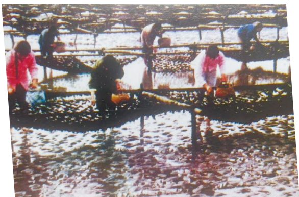
②吕四沿海滩涂紫菜养殖场。(市海渔局提供 1998年摄)