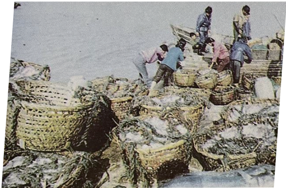
③春汛期间,渔民大获丰收,忙碌作业。