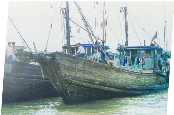
①1996年我市全面部署海洋渔业改制。