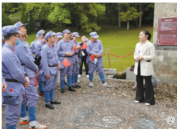
② 近日，南通二建上海公司党总支组织5家事业部35名党员群众，前往中国革命摇篮之一的古田，学习党史、瞻仰旧址、拜谒烈士。