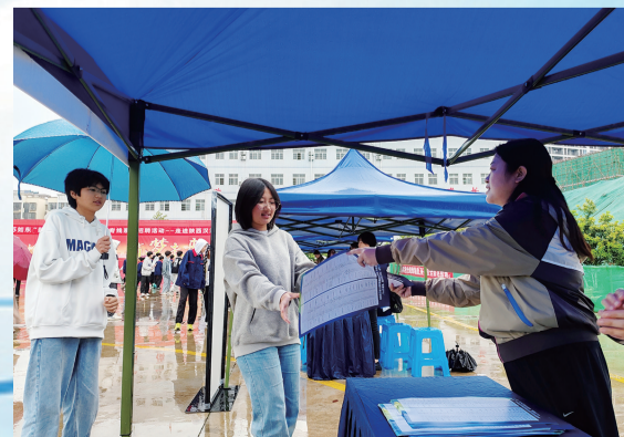
县人社局工作人员接受汉江技工学校学生咨询