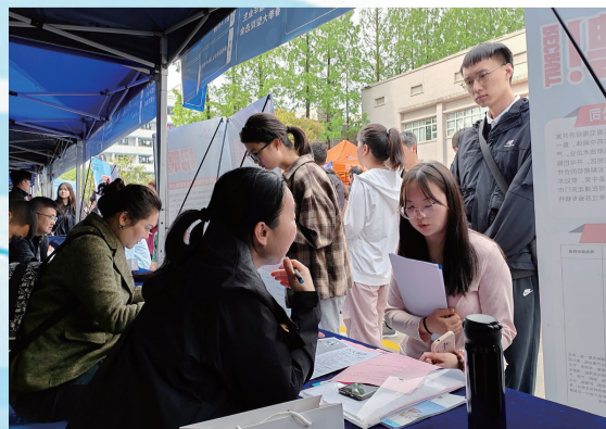
陕西理工大学2024届毕业生双选会现场