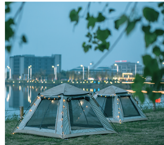
近日，以“泉海相约邂逅暖‘洋’”为主题的第七届小洋口海洋温泉节暨首届露营节在小洋口桃花岛启动。据了解，露营季系列活动从4月中旬持续到9月底，包含露营、无动力乐园、美食市集、乐队演出、星空电影和烟花秀等活动。同时，度假区还定制研学拓展、健康养生、团建定制、用餐住宿等特色旅游线路攻略，满足游客“吃、住、行、游、商、学”个性化旅行需求。