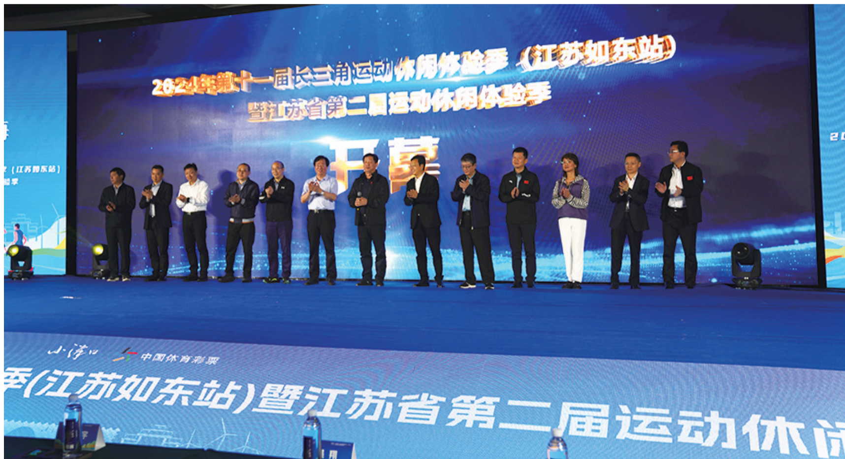
2024年第十一届长三角运动休闲体验季(江苏如东站)暨江苏省第二届运动休闲体验季活动开幕式。全媒体记者 单佳凯 摄