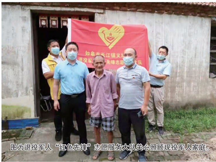
图为退役军人“红色先锋”志愿服务大队爱心人士照顾现役军人家庭。