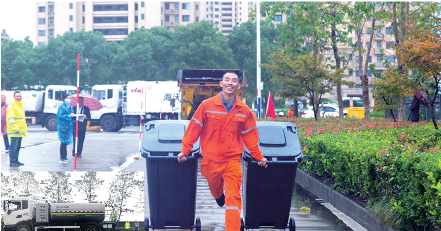
为进一步提升环卫技能，弘扬工匠精神，日前，市城市管理局举行“环卫工匠”作业技能竞赛。30余名环卫工人进行了垃圾中转清运、机械清扫、冲洗洒水等项目的角逐。

据了解，近年来，江苏有线如皋分公司不断探索党建融合，打造党建品牌。今年以来，该公司围绕建党100周年，创建了“爱在有线”党建品牌并精心打造，努力使这一品牌叫亮叫响。从年初的党员主动捐款为困难户免费购电视、免费送机顶盒的“暖冬行动”到三月份的“学雷锋志愿服务”、五月份的帮助联系户实现“微心愿”、八月份的“抗疫先锋在有线”、九月份的“文明典范城市创建进社区”等，到处都有江苏有线如皋分公司党员的身影。全体党员积极参加，主动投入，亮身份，办实事，彰显出国有企业的情怀和担当。