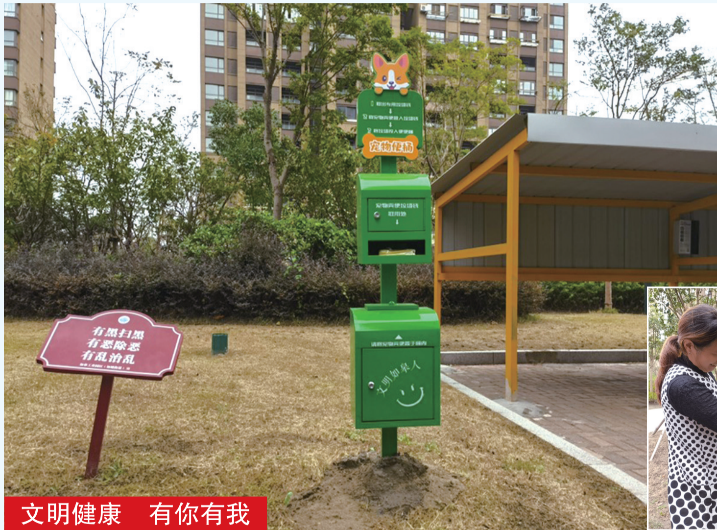
文明健康 有你有我

随着养宠市民的增多，不处理的宠物粪便不仅不卫生，还影响了小区及城市环境，针对这一现象，如城街道在辖区内所有老旧小区以及安置小区内，安装了233个宠物便箱，便于居民遛狗时能够及时清理、卫生投放。