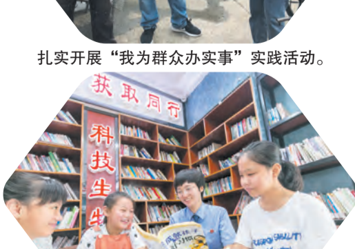
开展“精准普法月月行”活动，检察官为孩子们带来“开学第一课”。