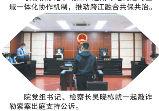
院党组书记、检察长吴晓栋就一起敲诈勒索案出庭支持公诉。