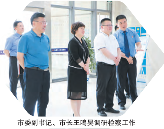
市委副书记、市长王鸣昊调研检察工作

论、实务“三导师”制度，聘请资深检察官担任高质量发展咨询委员，开展寻找“身边榜样”“月度之星”“国旗下的讲话”感悟分享等活动，提升人才综合素质。11名干警荣获南通市级以上业务竞赛标兵、能手称号，1项课题获最高检立项，17件案例入选省级以上公告案例、典型案例，先后50人次获得南通市级以上荣誉，涌现出省检察机关“守正有为检察官”“优秀办案检察官”等一批先进典型。