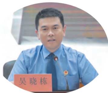
市人民检察院党组书记、检察长 吴晓栋

2022年，市人民检察院将紧扣全市工作大局，凝心聚力，奋力推进实施如皋检察“1335”新发展战略，围绕“换挡提速再出发，高原勇攀新高峰，奋力推动传统模范检察院向现代化检察强院跨越发展”目标，突出监督质效、办案力度和服务水平三个重点，推动人民群众满意度、检察工作贡献度和检察机关标识度提升，努力实现服务发展更加精准、监督质效更加凸显、为民服务更加高效，展现检察工作全新气象。