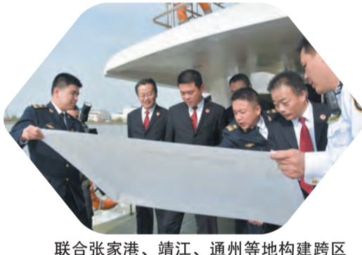
联合张家港、靖江、通州等地构建跨区域一体化协作机制，推动跨江融合共保共治。