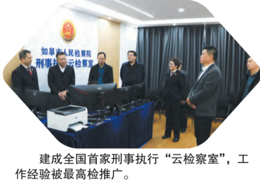
建成全国首家刑事执行“云检察室”，工作经验被最高检推广。