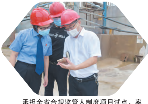
承担全省合规监管人制度项目试点，率先在全市启动第三方监督评估机制办理一起虚开增值税专用发票案。