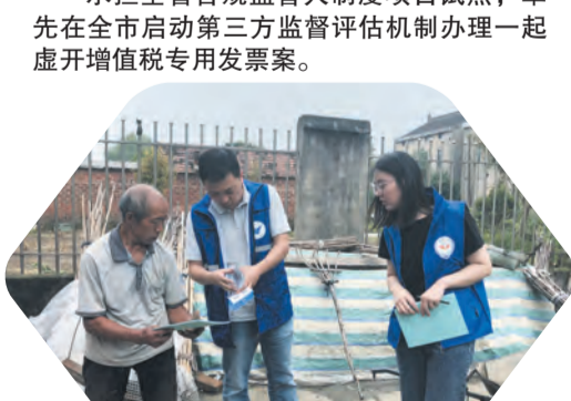
扎实开展“我为群众办实事”实践活动。