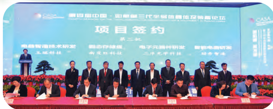
第四届中国·如皋第三代半导体晶体及装备论坛成功举办 ▲