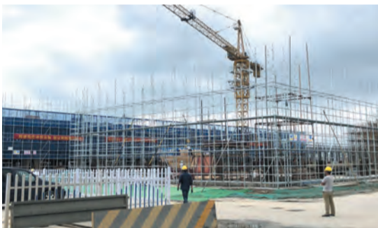
如天光电车载3D盖板玻璃生产线项目加快建设