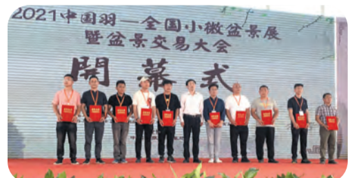
全国小微盆景展暨盆景交易会 ▲