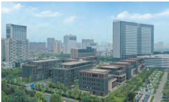
软件园二期（科技企业孵化器、众创空间）开园运营