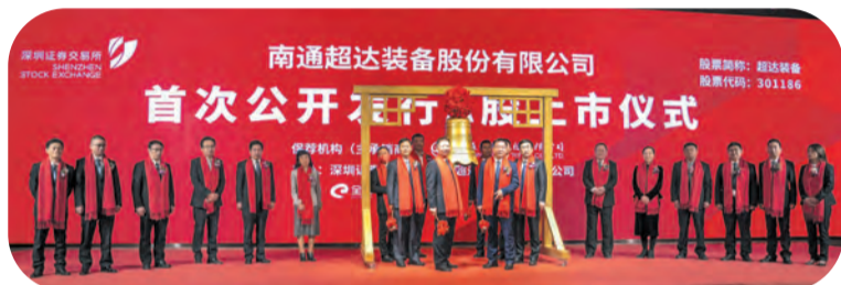
南通超达装备股份有限公司成功上市 ▲