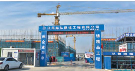
际弘第三代半导体材料、功率器件模块及新能源汽车零件生产项目加快建设