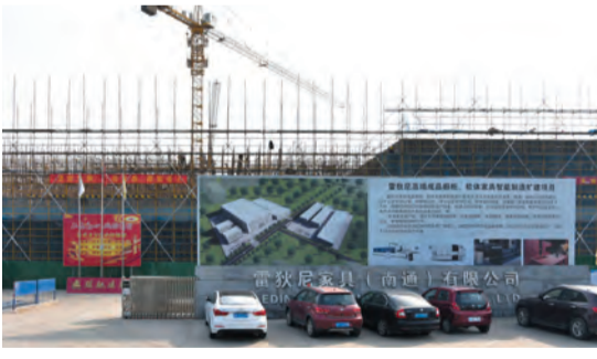
雷狄尼高端成品橱柜、软体家具智能制造扩建项目开工建设