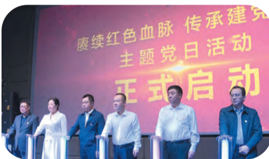
“赓续红色血脉，传承建党精神”主题党日活动正式启动

党的建设持续加强。 高质量推进党史学习教育，办实事办结率100%。开展中心组学习17次，南通市级以上外宣报道140篇次，创成省文明村、文明单位4个。省“双创计划”人才任务数2人、完成3人，申报“雉水英才”项目6个。完成村级党组织换届，落实村干部专职化管理，公开选聘村（居）“两委”正职后备干部，3个村（社区）获评市星级党组织。新建非公企业党组织5个，打造华夏电影等2个红色教育基地。在全市率先开展主题党日活动，成立“红领党务通”工作室。定期召开选代表议政会、开展视察调研活动，实施提案办理协商“清单”制，市人大代表换届选举工作依法依规有序推进。