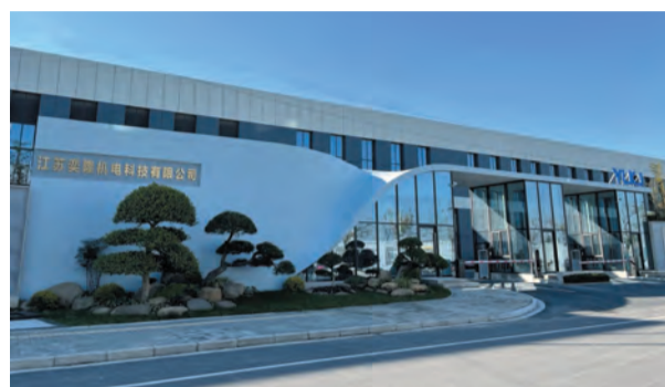
江苏奕隆机电有限公司

整合”走在前列，在全省率先建成智慧广电乡镇。社会保障有力促进。多渠道发布用工信息，为求职者就业、择业和企业用工搭建平台、提供更多机会，利用公益性岗位等措施帮助6人成功就业，城镇新增就业人数389人，企业职工养老保险新增参保人数1233人，城乡居民养老保险转企业职工养老保险人数940人，均超额完成市交任务。