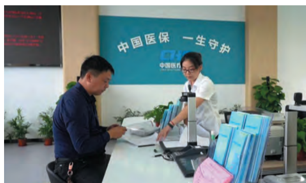
省级“15分钟医保服务圈”示范点