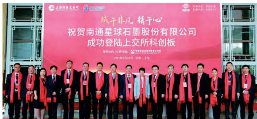
南通星球石墨股份有限公司挂牌上市