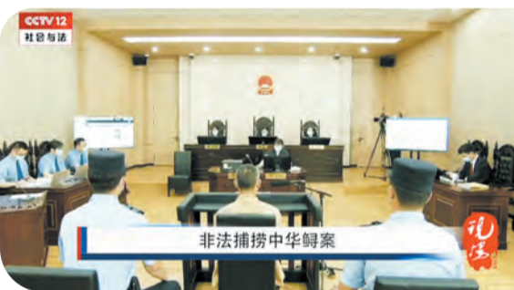
央视直播“中华鲟”案庭审，425万网友关注评论