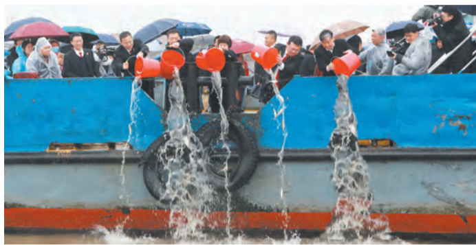
长江镇生态修复基地成立当日，向长江放流鱼苗14.7万尾