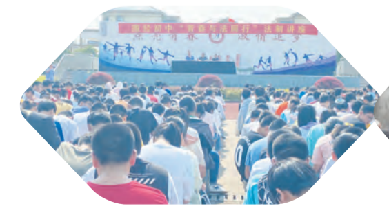
法治教育进校园，润物无声护成长