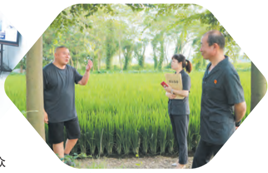
法官地头调解，解开百姓心结