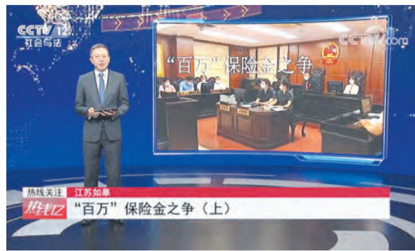
“百万保险金”之争案在央视播出，引发观众广泛关注