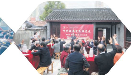
到迎新社区百姓茶馆，为群众开设普法课堂