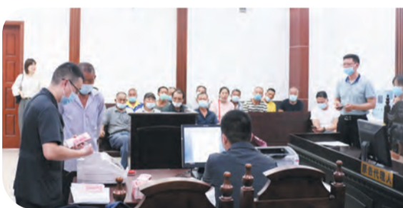
向12名农民工集中发放44万元工资款