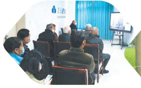
周末“支云e站”在线庭审，多名群众闻讯赶来旁听