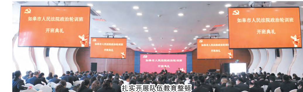
扎实开展队伍教育整顿