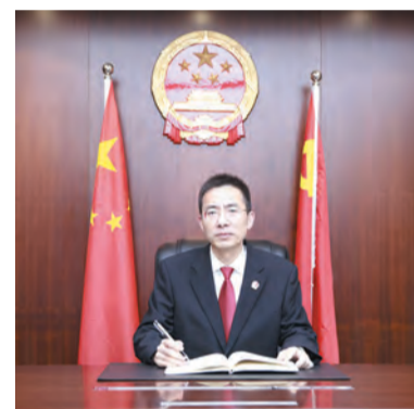
市人民法院党组书记、院长 唐明渠

2022年，市法院将立足守正创新、稳中求进工作总基调，充分发挥审判职能，更加注重系统观念、法治思维、强基导向，在新时代新征程上努力为如皋高质量发展贡献法院智慧和力量。