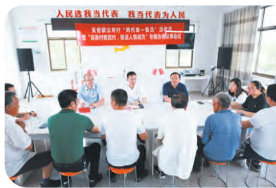
走访基层，倾听民声

把能力建设作为关键，定期开展分层分类培训1000余人次。打造专家型、学者型法官，26篇调研成果获南通市级以上奖项，8篇案例入选《中国法院年度案例》，居南通基层法院首位。优化法官助理管理办法，工作做法受到省委政法委的推广。