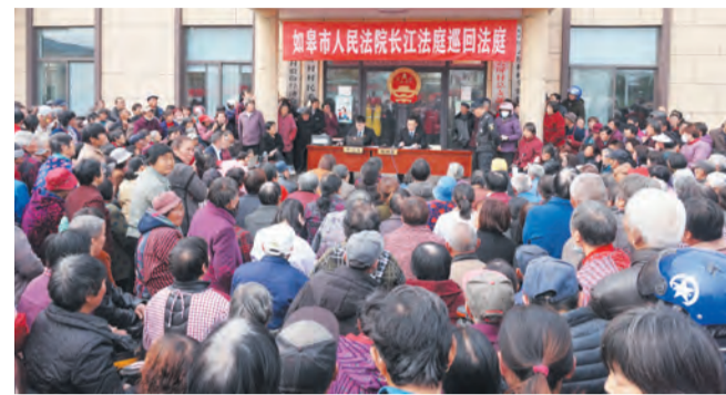
法槌敲响，家门口的庭审获点赞