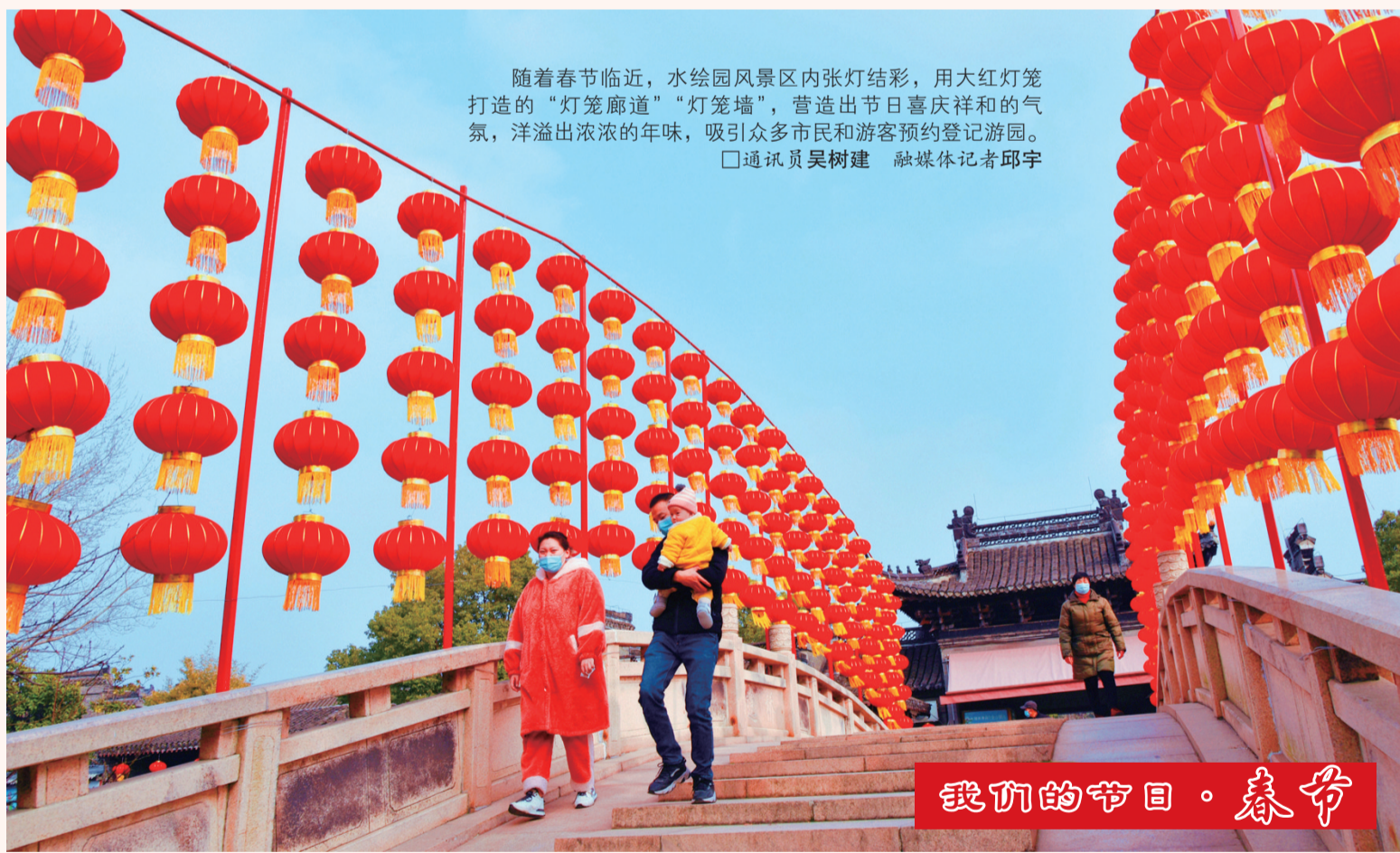
随着春节临近，水绘园景区内张灯结彩，用大红灯笼打造的“灯笼廊道”“灯笼墙”，营造出节日喜庆祥和的气氛，洋溢着浓浓的年味，吸引了众多市民和游客预约登记游园。 □通讯员吴树建 融媒体记者邱宇