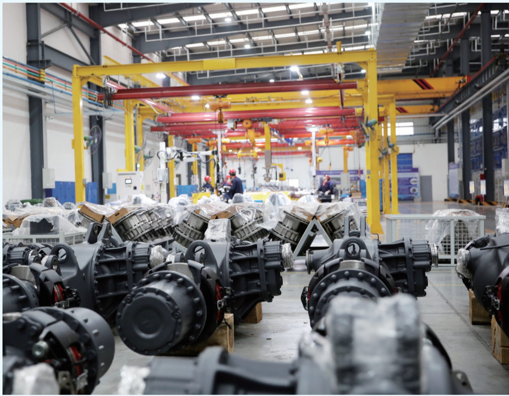
近日，在位于长江镇的华永商用车电控空气悬架与自动变速箱项目的生产车间内，工人们正紧锣密鼓地进行产品生产。据了解，该项目由江苏华永复合材料有限公司投资建设，主要从事高强度轻量化汽车底盘产品及高性能传动产品的研发和制造。 □融媒体记者邱宇