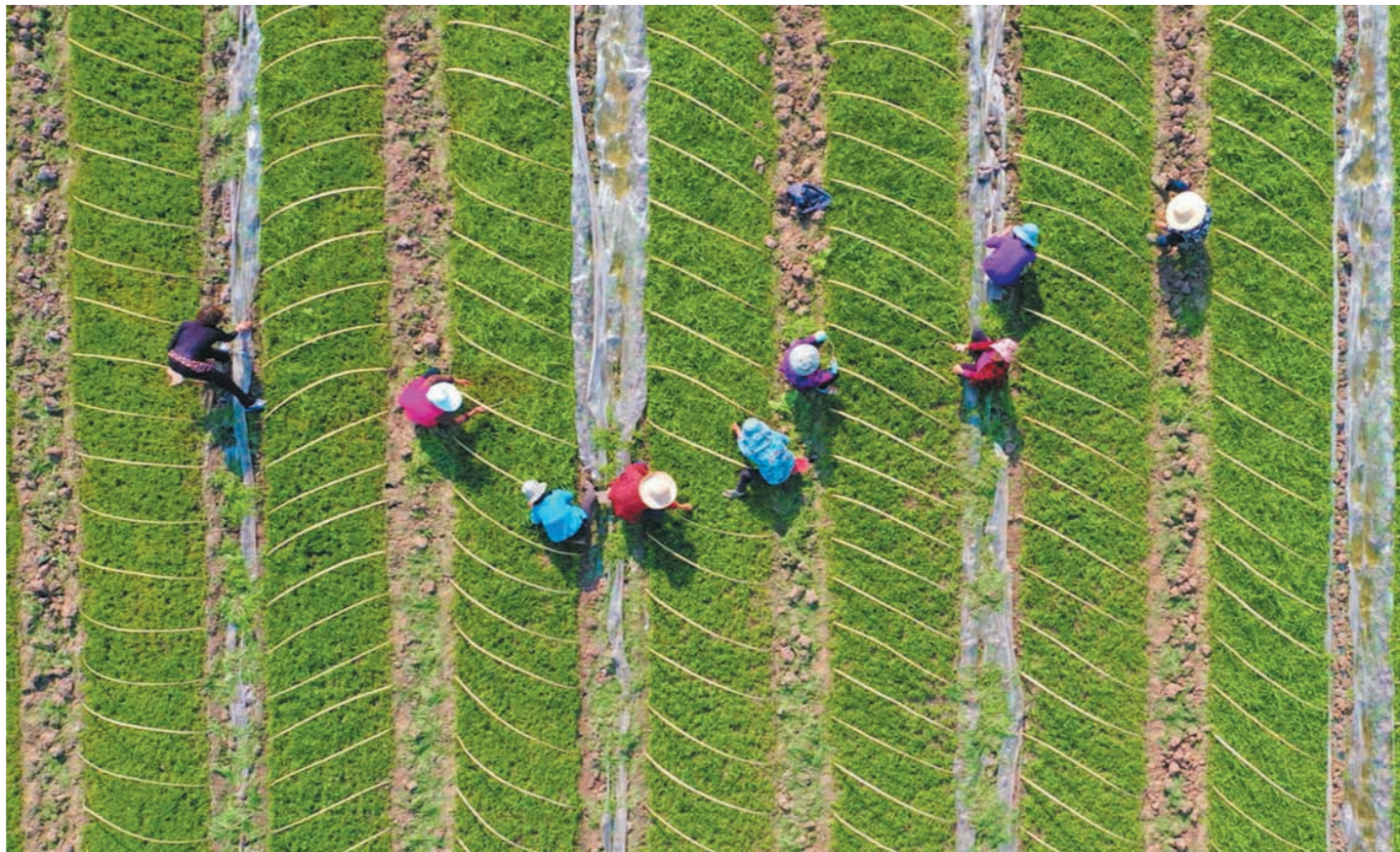
仁和镇莲花台村村民在早育秧田内除草

四川经济日报南充讯(南充记者 李国富 文/图)春耕开好局、起好步,对全年粮食生产和农业丰收具有重要作用。近日,记者踏访西充广袤田野,各地抢抓农时,辛勤劳作,处处呈现出一幅人勤春来早、春耕备耕忙的生动画景。