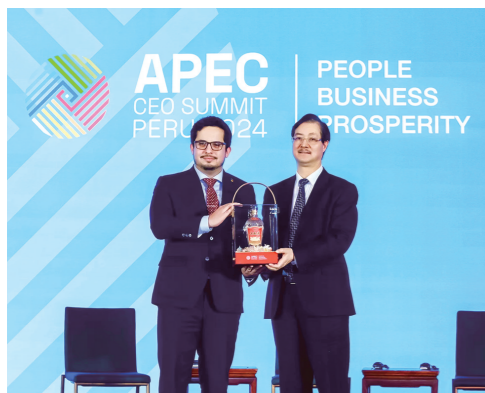
发布2024年APEC&五粮液联名款纪念礼盒