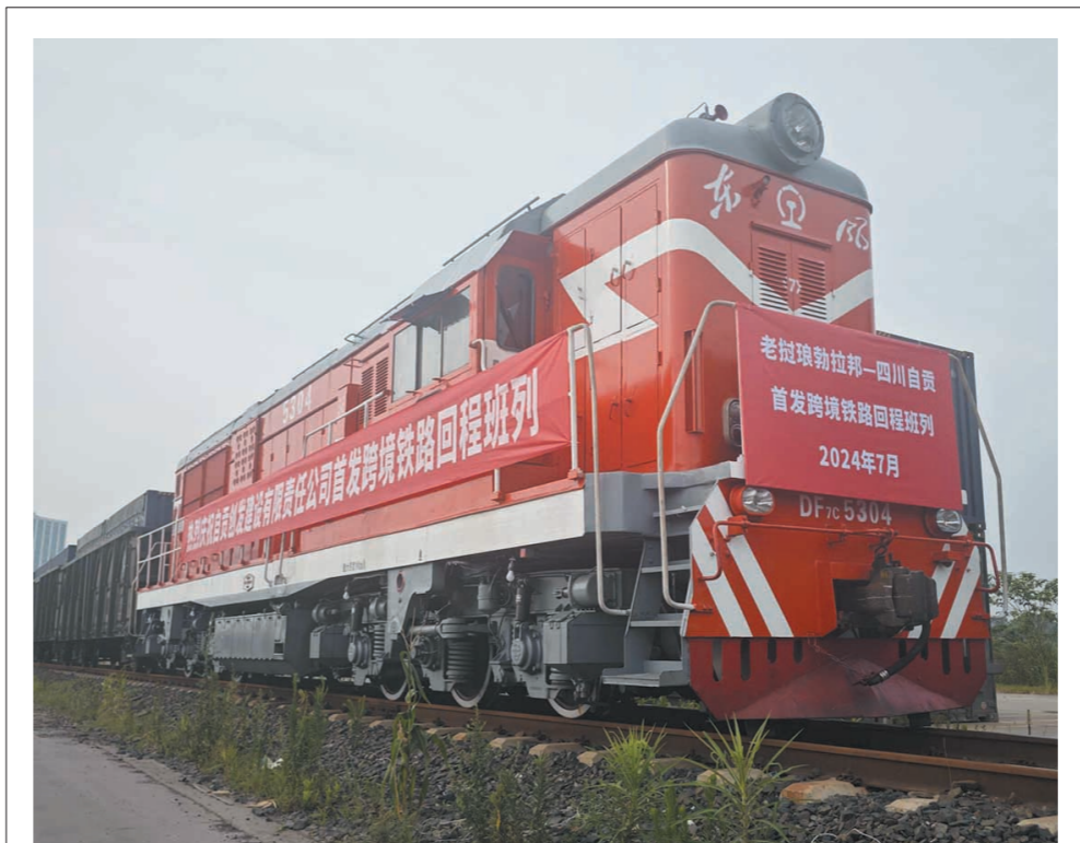
琅勃拉邦—自贡跨境回程班列