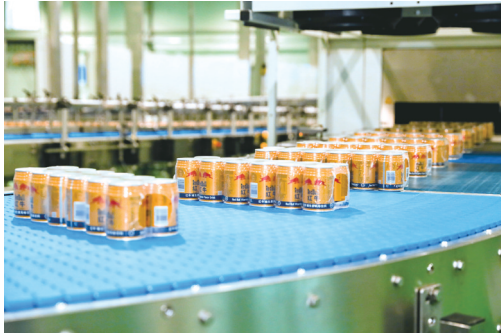
泰国天丝红牛饮料生产线

周转箱来自于四川日牵物流装备有限公司。装卸、堆垛曲轴用到的新能源叉车产自于四川集世迈物流装备有限责任公司。上述四家企业全部位于内江经开区工业园区，四方通过供需互补，极大节约了采购时间，实现了降本增效、互利共赢。 政府从中“牵线搭台”，供需双方“牵手合作”。在内江经开区，通过积极搭建产业链供应链协作配套对接平台，帮助企业揽订单、拓市场，畅通工业供需“内循环”，已成为该区优化营商环境、服务企业发展的一项重要举措和鲜明特色。 营商环境是企业生存发展的土壤，更是经济发展的“晴雨表”。营商环境好不好，企业感受最敏锐。为找准市场主体发展过程中的痛点、难点和堵点问题，进一步深化助企纾困，激发市场主体活力，近日，内江经开区在全区上下持续深入开展“百名干部进千企”活动，全区干部职工全员下沉一线，面对上门走访服务、一对一收集意见建议、点对点协调解决困难问题，以前所未有的工作力度攻坚推动营商环境实现大提升。 9月13日，工作人员在走访全球最大的笔记本外壳生产企业——巨腾（内江）资讯配件有限公司时，得知企业“特殊技术工种人员招聘困难，希望政府提供更多技术工种招聘渠道”。同日下午，内江经开区就业和社会保障局就予以初步答复，表示将持续收集用工需求，通过内江经开区微信公众号、内江就业创业协会、乡镇农民工微信群等线上渠道持续发布招聘信息，增加企业招聘信息曝光度。同时，通过高频次举办现场招聘会、入企探岗、跨区域进高校招聘等方式，帮助企业招引人才。 “对收集到的各类困难问题和建议意见，我们分类建立台账，严格按照‘责任制+清单制+销号制’的方式，推动个性问题单独解决、共性问题统筹解决，为企业发展疏通堵点、化解痛点、消除难点，持续优化市场化法治化国际化便利化营商环境，切实提升全区经营主体满意度。”内江经开区相关负责人表示。