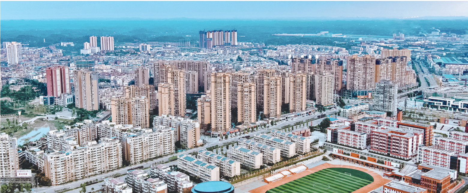
威远县城航拍

“ 8月30日上午，四川发展兴欣能源科技有限公司60000m³/a短流程钒电解液产线建设项目首批设备正式入场，并成功实现首吊，项目正式进入设备安装阶段。 该项目自今年3月21日正式开工以来，在各级部门和领导的大力支持和帮助下，在全体建设者的共同努力下，克服诸多困难，严格按照时间节点推进，确保了各项工作的顺利推进。 项目的建成投产不仅代表着该公司在钒电解液领域的领先地位，也体现了公司对市场需求的深刻理解和快速响应能力。 产业强，则县城兴。近年来，威远县加快推进县域传统产业转型升级，促进重点产业向高端化、智能化、绿色化迈进，优化产业结构，加快探索和形成符合县域区域特点的现代产业链条。