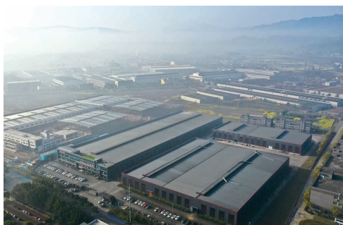
航拍四川洪雅经开区