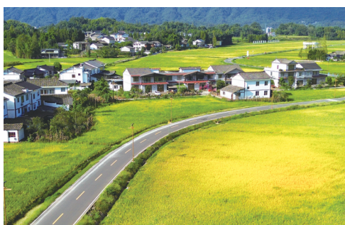
“天府粮仓”洪雅示范区