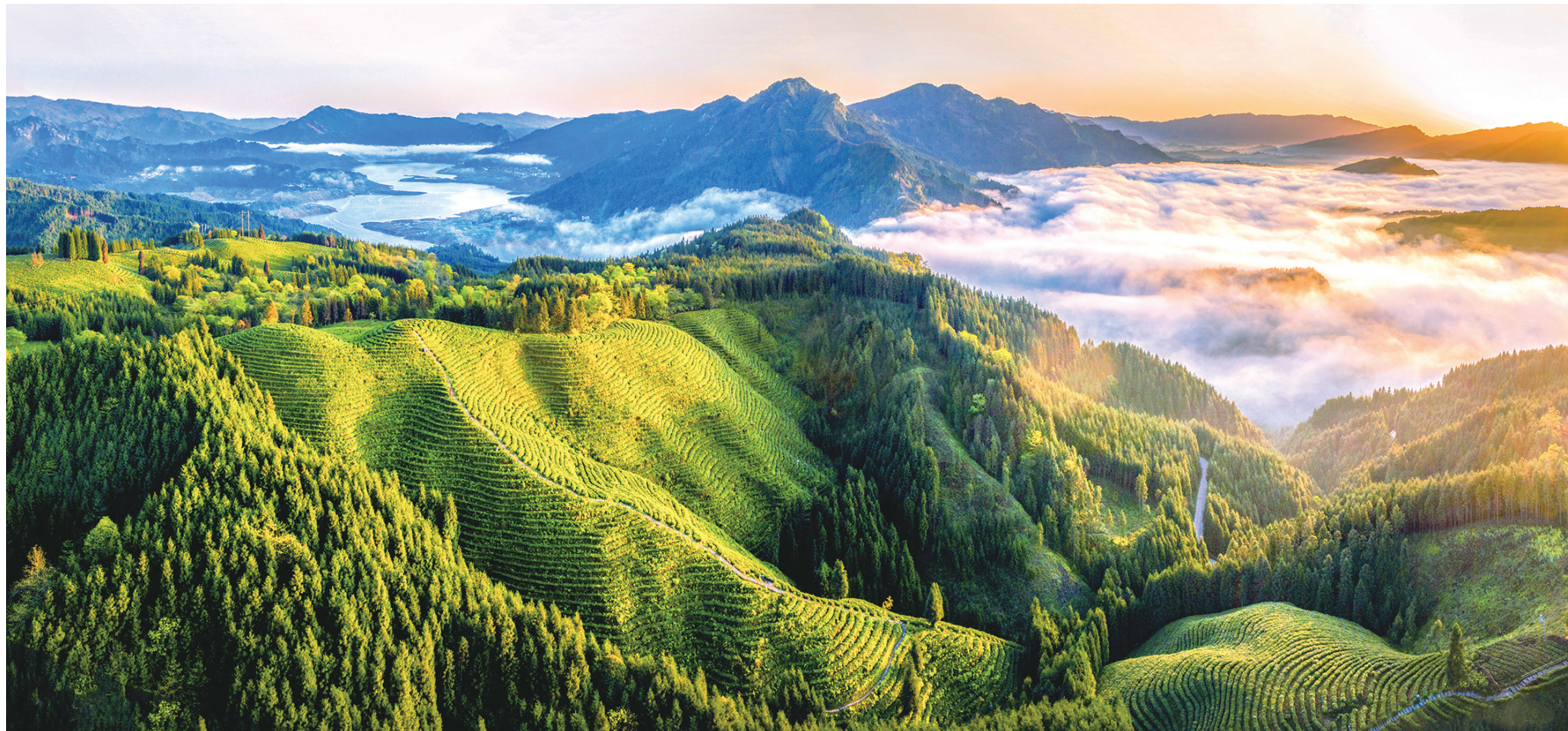
洪雅瓦屋山复兴茶山

绿色是洪雅的生态底色，也是洪雅的发展优势。近年来，洪雅县以“两山”转化示范县、绿色发展先行区目标为导向，将绿色发展贯穿于县域经济社会发展的全过程。通过不断探索和优化绿色发展方式，打造“天府粮仓”洪雅示范区，以“智改数转”力促传统产业转型升级，以新质生产力引领新兴产业蓬勃发展，同时厚植生态底色，依托良好生态禀赋大力发展旅游业，走出了一条“绿水青山就是金山银山”的高质量发展之路。