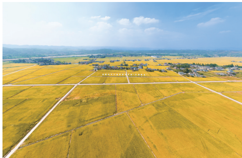
洪雅止戈安宁万亩核心示范区高标准农田