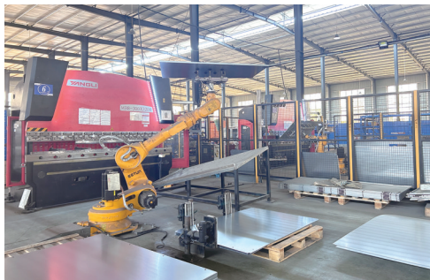
四川尖端科技有限公司生产车间，全自动折弯机械手臂设备正在全力作业