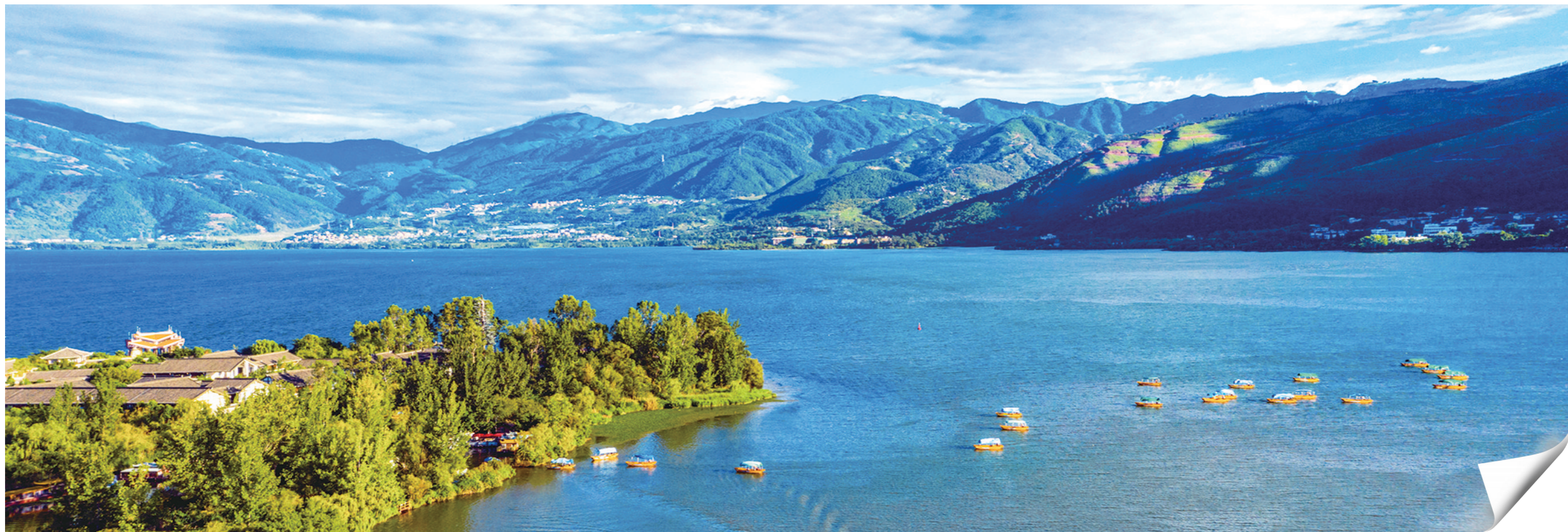
西昌山水之间