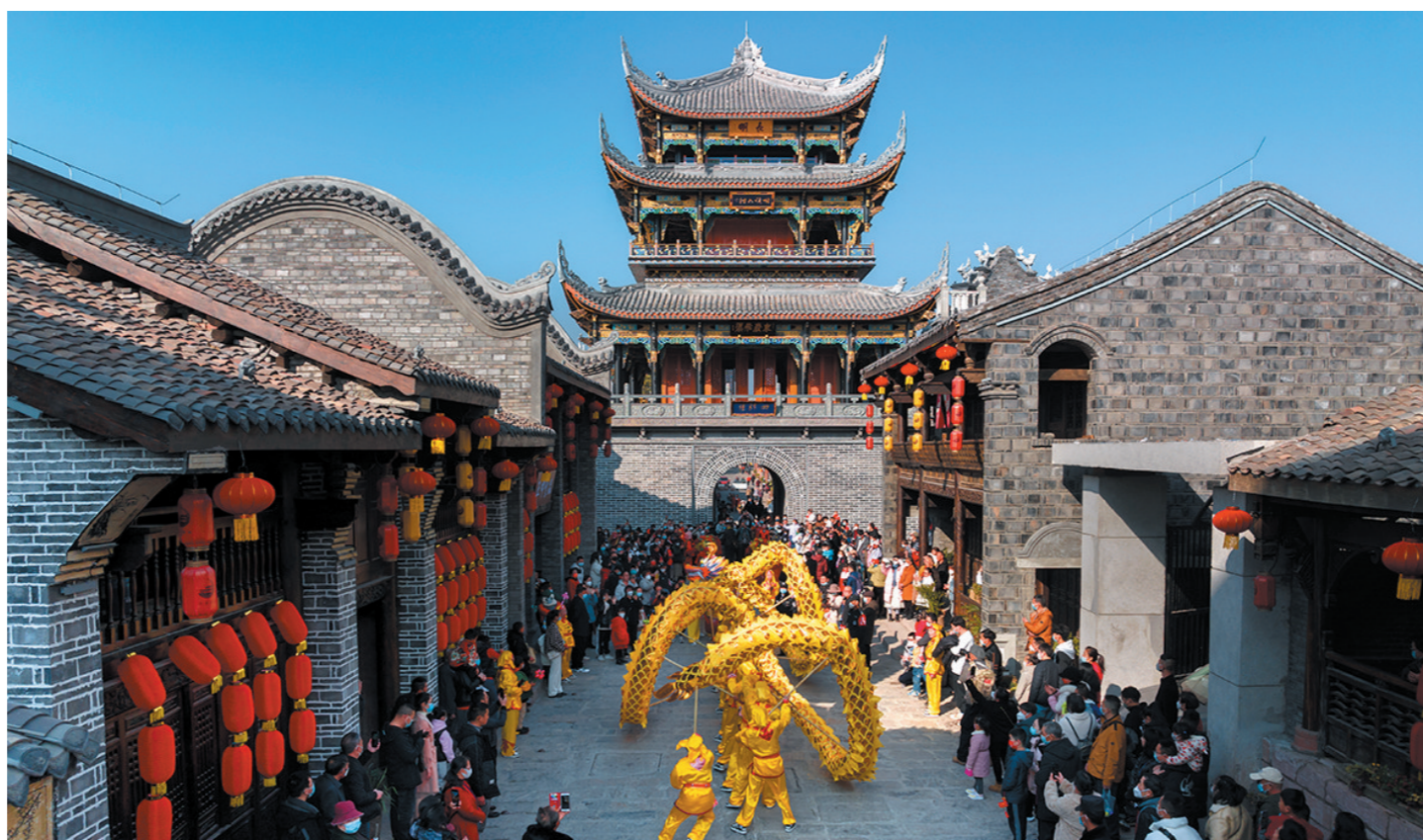
建昌古城