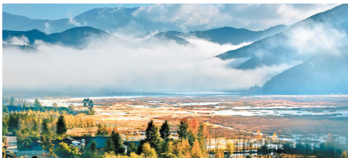
大美泸沽湖