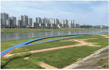
沱江资中城区北岸生态长廊