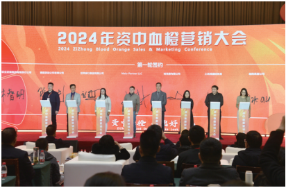
签订资中血橙出口协议

2025年1月2日上午，四川省2024文化发展十件大事揭晓，“刀郎、李子柒装满全网情怀 引燃顶流效应”成为2024四川省文化发展十件大事之一。 刀郎的家乡在资中。依托刀郎的出圈，资中已经建成音乐广场，设立公交专线，举办文化惠民活动。全国各地游客到资中旅游打卡，千年古城迎来了新的活力。 文旅出圈，城市出彩。这座拥有近两千年历史的历史文化名城，以厚重的历史底蕴为底色，以创新的发展模式为引擎，在历史与现代的交响中，奏响着一曲曲华美的乐章。 2024年，资中县锚定加快建设成渝发展主轴绿色产业强县活力文化名城目标，紧扣县域经济高质量发展促进城乡融合发展，成功入选全省强县扩权赋能改革试点、全省市域副中心培育名单，获评全省县域经济高质量发展进步显著县。