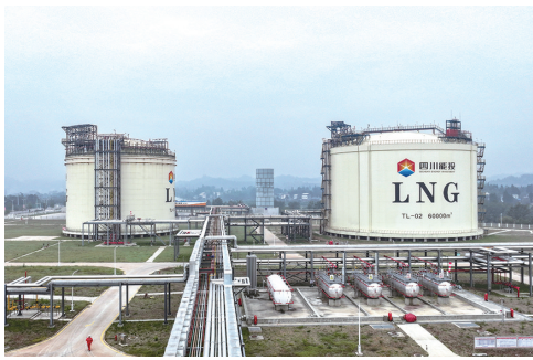
四川能投遂宁储气调峰基地项目