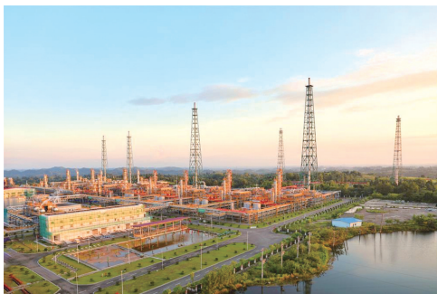
中石油遂宁天然气净化公司