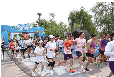
2025全民健身走(跑)大赛暨川台同家乡镇“横山”青年文体交流活动