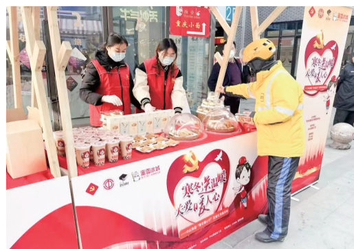
党员志愿者在商圈设摊,提供暖心服务。

记者从区妇儿工委了解到,松江还将在“十四五”期间开展儿童友好社区创建暨“萌童乐园·儿童之家”建设项目,升级改造区妇女儿童发展中心,建设区级学生发展指导中心,建设区儿童早期发展基地,推进儿童精神医学专科医师培养和培训。