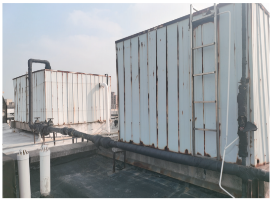
上图:原二次供水的天台水箱已经废弃。 右图:改造后的水房。