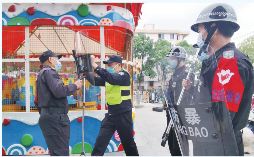
图为在同乐生活广场“平安屋”,社区民警正对商圈安保人员进行防暴指导。

本报讯(记者 王梅) 11月23日下午,洞泾镇第39家“平安屋”在光明云庐小区建成。据悉,该镇共规划建设65家“平安屋”,以此构筑群防群治网络,并在公安机关的指导下分类施策做好先期控制与处理,力求在突发事件应急处置中“再快一分钟”,打通基层安全治理“最后一公里”。