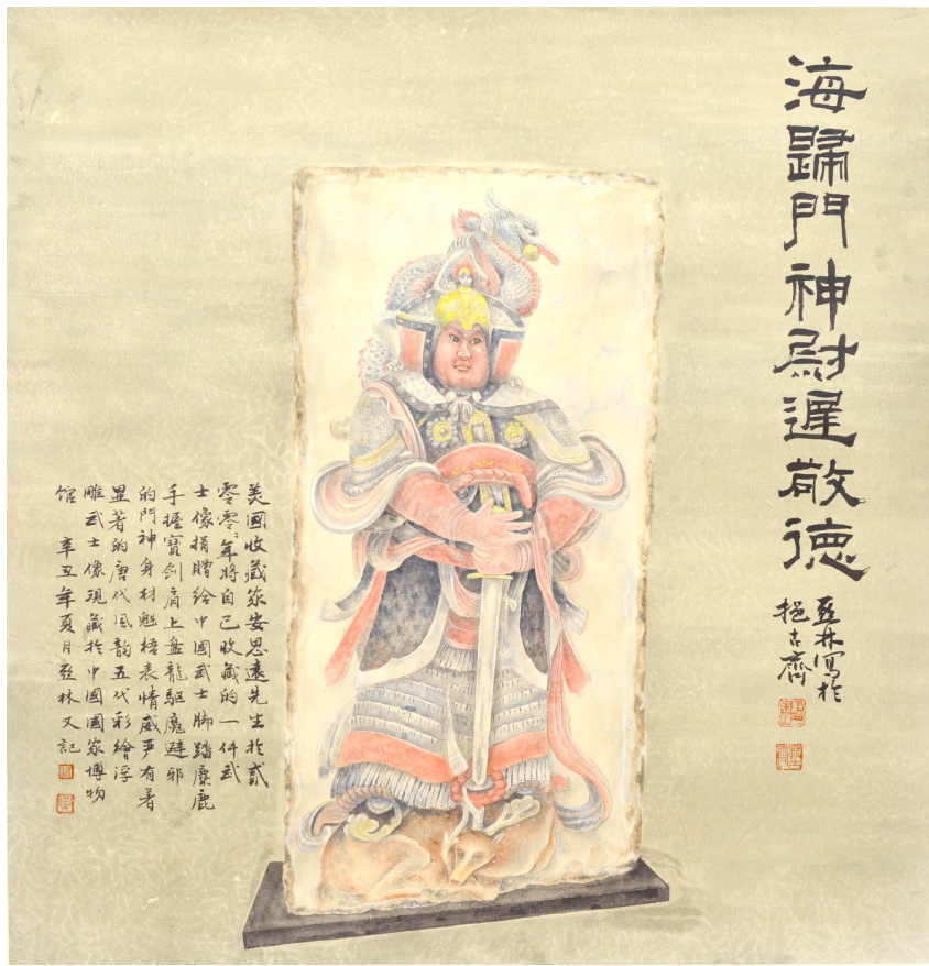
海归门神尉迟敬德