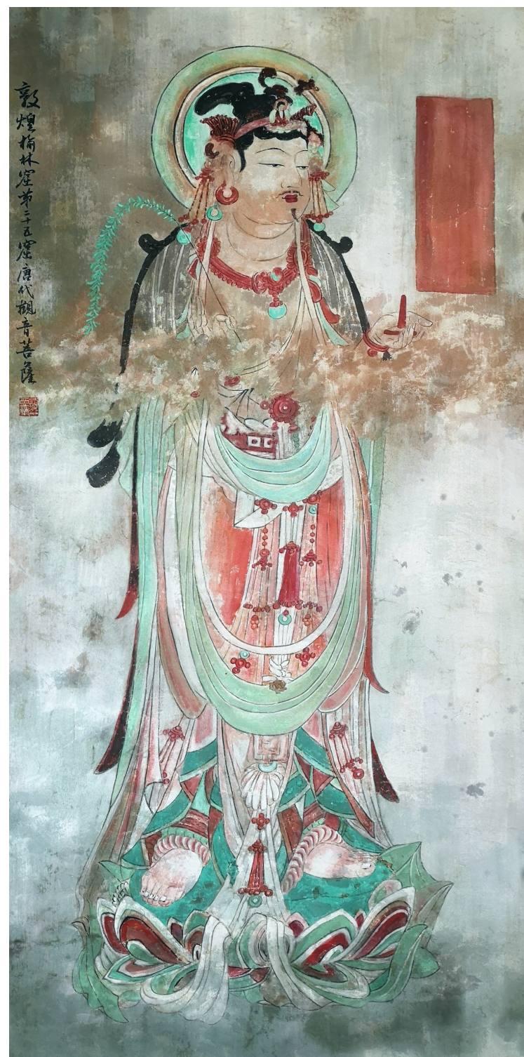
嵇亚林《慈悲怡然》(敦煌榆林窟第25窟观音菩萨 中唐)

出版有《文化行迹》《嵇亚林文集》《嵇亚林水墨画集》《闲墨澄怀》《我站在画布面前：苏天璐的艺术世界》《花开见佛：陈之佛的艺术世界》等专著。