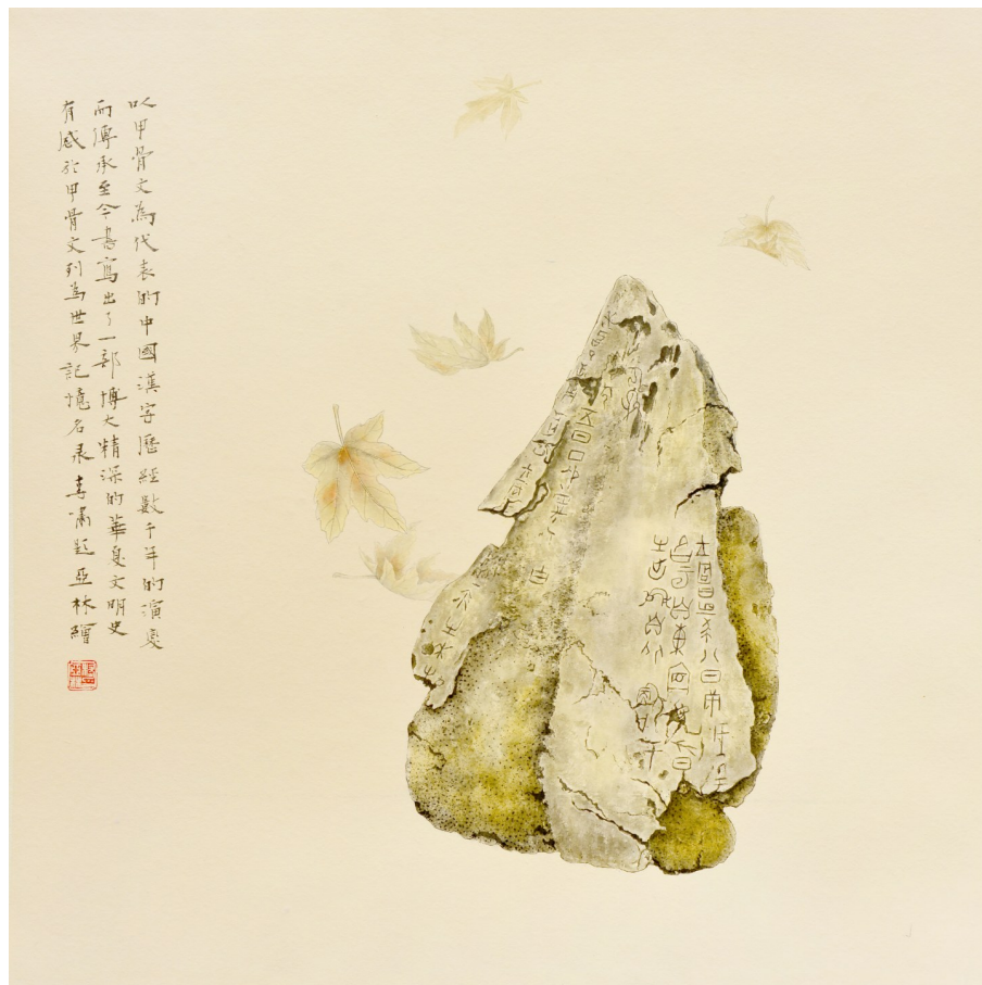
天佑中华(甲骨文馆藏)