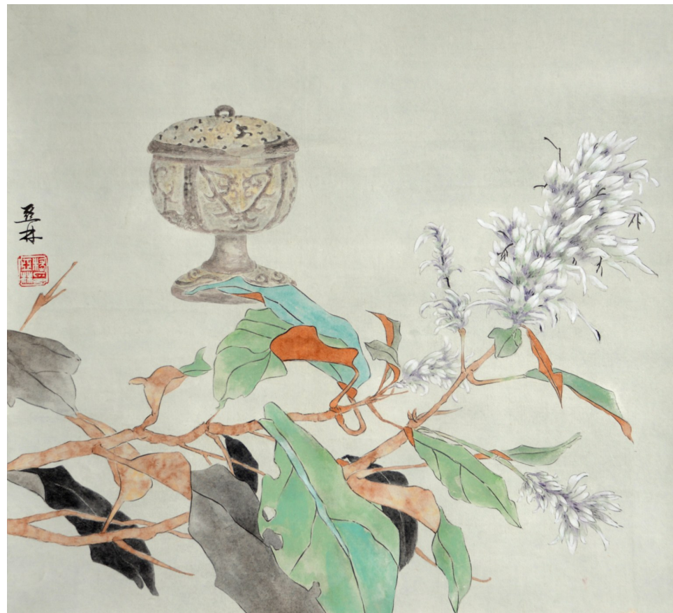
薰香烟奁 43cmx46cm 2021年