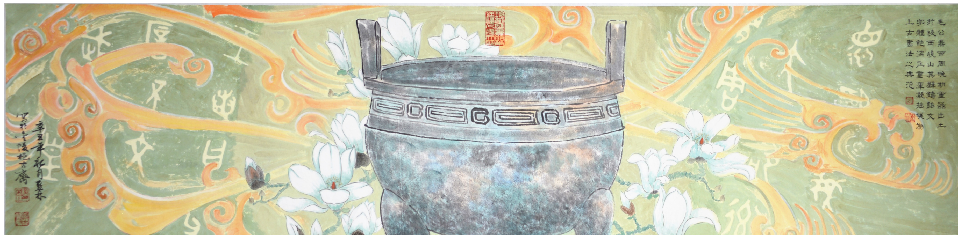
鼎立华夏写春秋 34cmx138cm 2021年