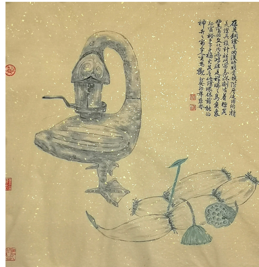
沉鱼落雁 70x70cm 2023年