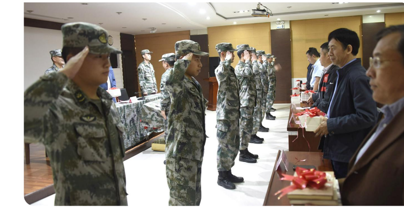
地方部门向驻军部队赠送图书