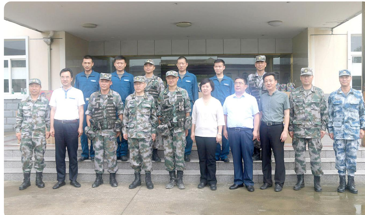
市县领导走访慰问射阳驻训部队