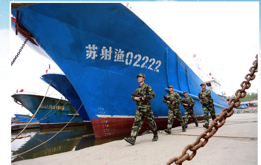
驻射武警部队开展日常巡逻