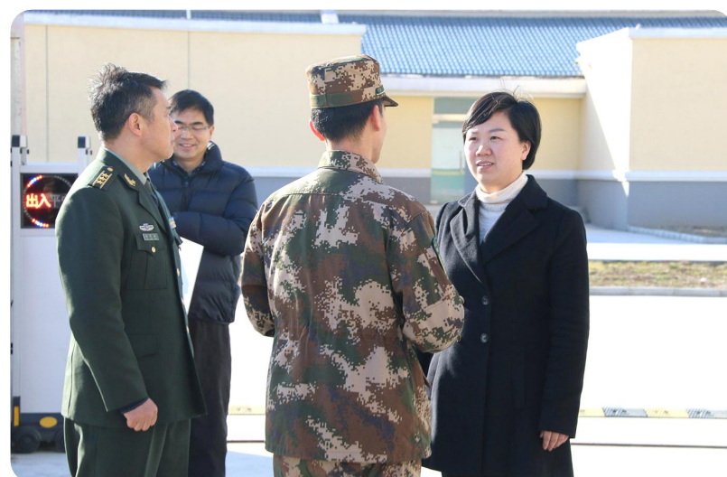
县委书记吴冈玉走访驻军部队