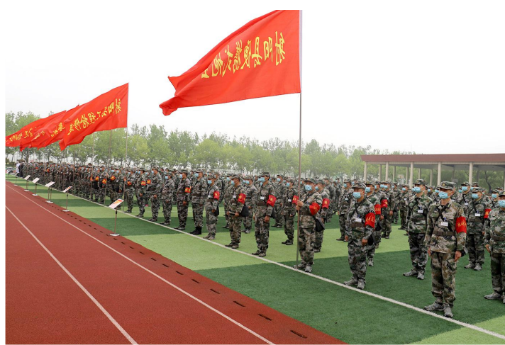
射阳县民兵和拥军支前保障队伍整装待发

射阳县地处江苏沿海中部,海岸线长103公里,土地总面积2606平方公里,75.9万人口,其中优抚对象近3万人。射阳军民以习近平总书记对双拥工作的重要指示精神为引领,继承“听党话、跟党走、心连心”的优良传统,先后7次被省委、省政府、省军区命名为双拥模范县。