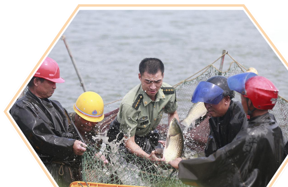
驻射部队官兵帮助群众开展水产养殖