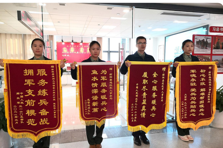
拥军办实事成效显著