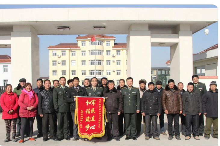
周边群众送锦旗感谢部队扶贫帮困