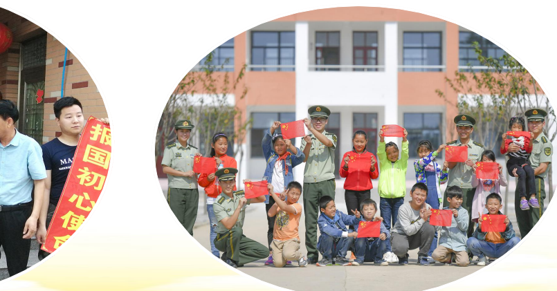
驻军部队官兵进校园担任国防教育辅导员