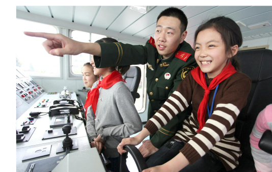
国防教育日邀请青少年学生体验军营生活