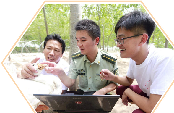
部队官兵指导群众科学养殖家禽