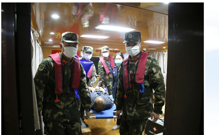
驻射部队官兵抢救受伤渔民