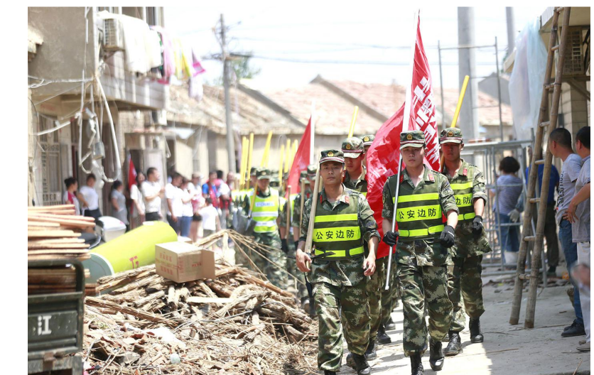
驻射武警部队参加抢险救灾