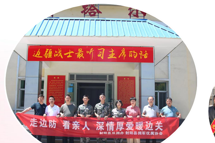
县双拥办和拥军优属协会联合开展“情系边海防活动”