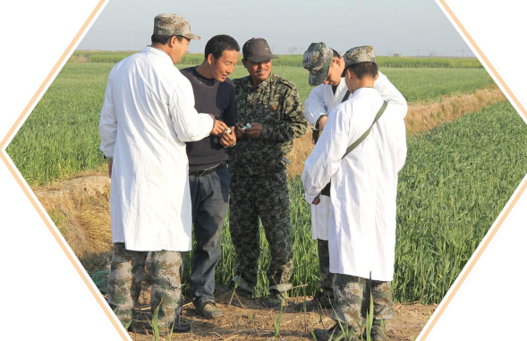
驻军部队军医和卫生员到乡间田头为群众送医送药