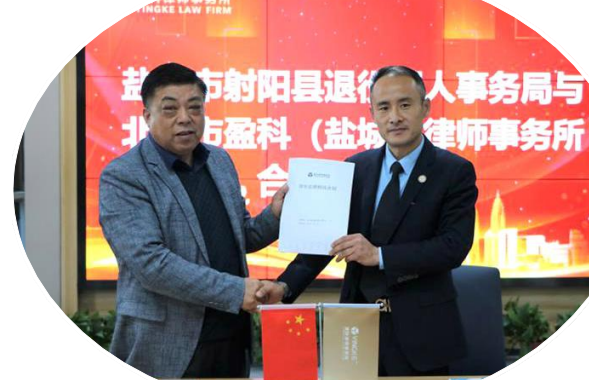
县退役军人事务局聘请专职律师担任法律顾问,为退役军人和军属提供法律服务