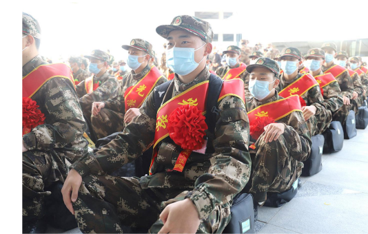
欢送新兵活动现场