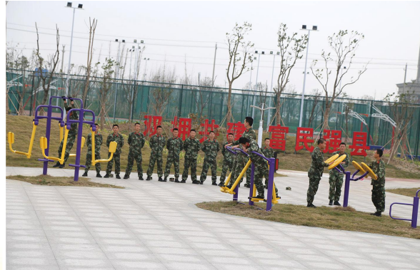
射阳县双拥公园一角

守护平安,铸就忠诚军魂。驻射部队为地方发展作贡献,哪里最困难,哪里就有子弟兵;哪里最危险,哪里就有人民子弟兵。2016年6月23日,射阳遭受特大龙卷风冰雹灾害,驻射部队官兵立即投入抢险救灾,连续奋战6昼夜,出色完成了排险人员、疏通道路、抢救财产、抢救粮食、恢复重建等急难险重任务,用热血和忠诚对新时代双拥事业作出精彩诠释。