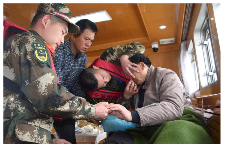
驻军部队官兵救治受伤群众

军爱民,民拥军,爱人民,爱戎装。射阳军民传承发扬拥军优属、拥政爱民的优良传统,能深能细做实双拥工作,提升双拥工作水平,不断谱写军地一家亲、军民鱼水情的时代篇章。