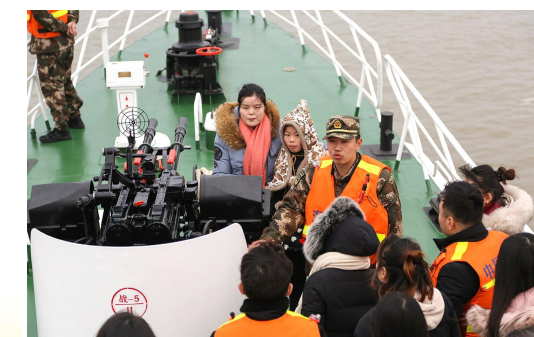
驻军部队开展军营开放日活动