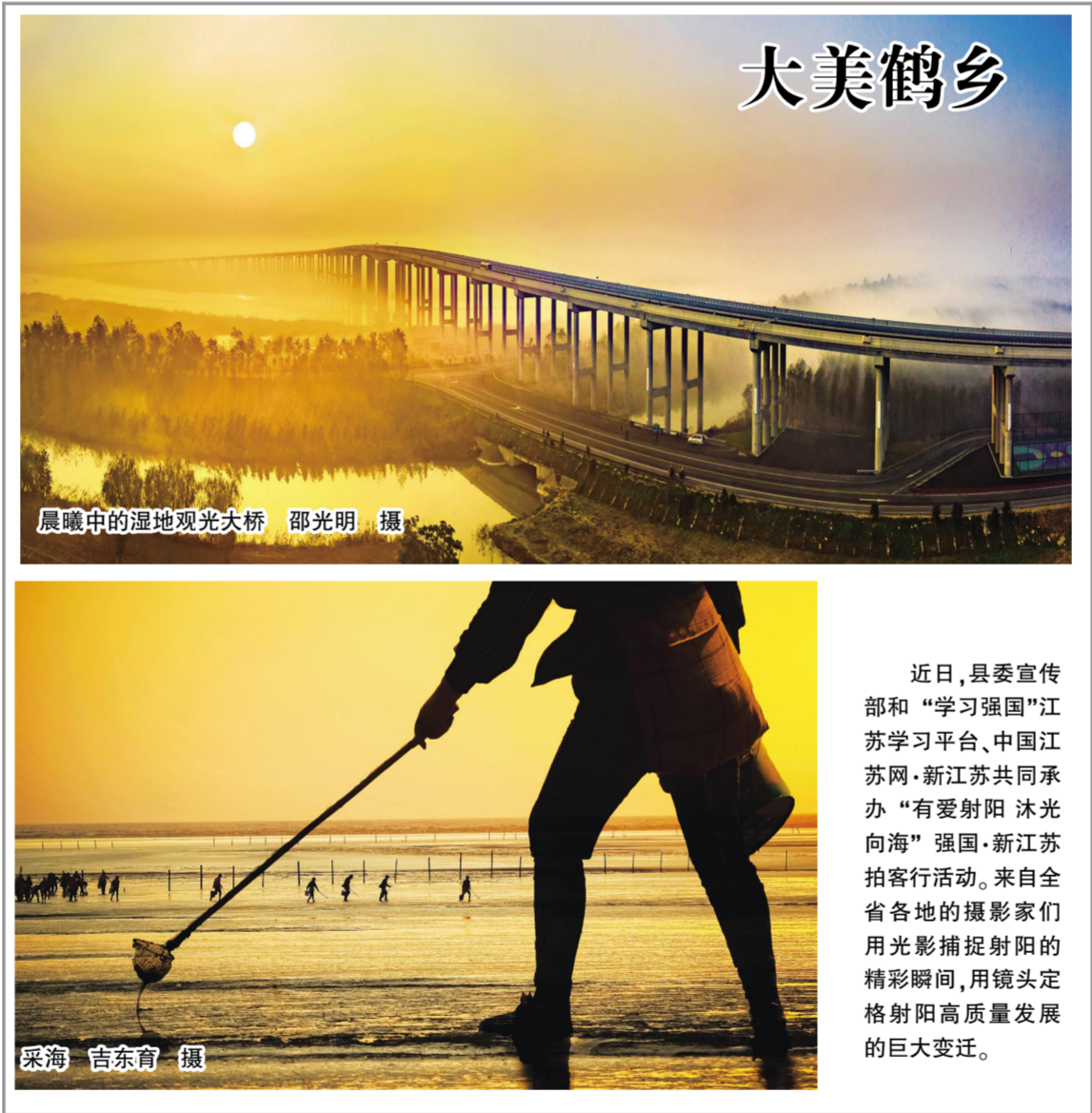
展曦中的湿地观光大桥 采海