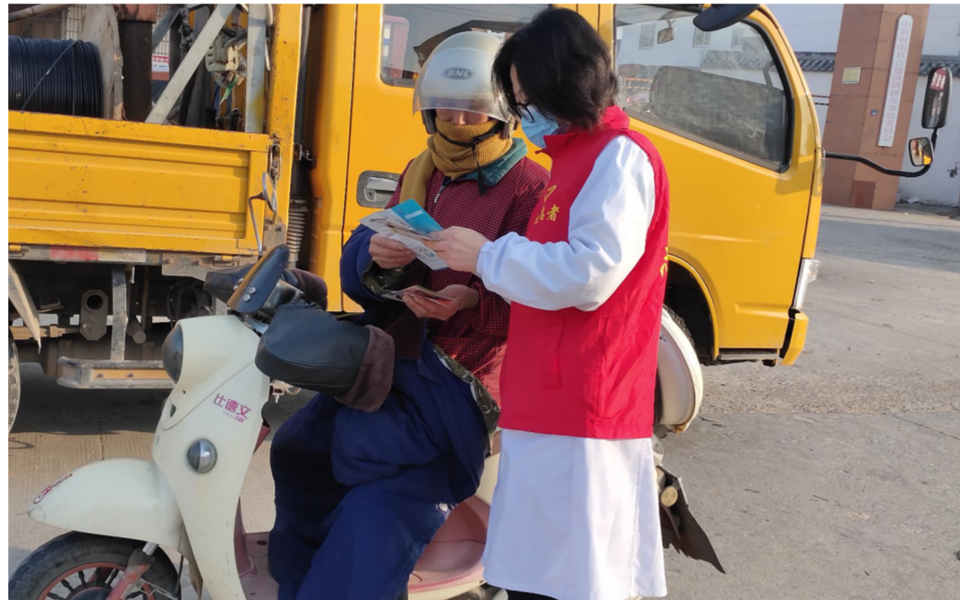
日前,耦耕卫生院组织医护人员走上街头开展艾滋病公众健康咨询活动。图为活动现场。

本报讯(通讯员 张丽娜)12月1日是第34个“世界艾滋病日”,今年宣传活动的主题是“生命至上,终结艾滋,健康平等”。为进一步普及艾滋病防治知识,增强个人健康责任意识,深入推进艾滋病防治各项工作,积极营造全民参与艾滋病防治工作的良好社会氛围,连日来,县疾控中心牵头组织开展了系列宣传活动。