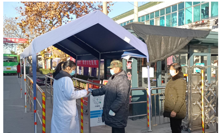
连日来,长荡卫生院切实做好疫情防控检测关,对来院的患者以及家人一律检查行程码和测量体温。图为该院工作人员为入院人员测量体温。

在提升基层医疗服务水平方面,该院下足“绣花功”,积极参与慢病干预项目,开展多项慢性病基础研究和措施干预,进一步提升村居卫生室服务能力,积极运用互联网技术开展远程会诊、远程心电图诊断,并实现了该镇20个村居手机APP档案更新及慢病随访全覆盖。此外,该院的家庭医生签约服务“有声有色”,结合实际围绕0-6岁儿童、糖尿病、高血压、慢阻肺等4类人群开展“点单式”签约,并以团队形式深入各村卫生室开展履约服务,安排骨干医生护士为离休干部提供上门履约服务。