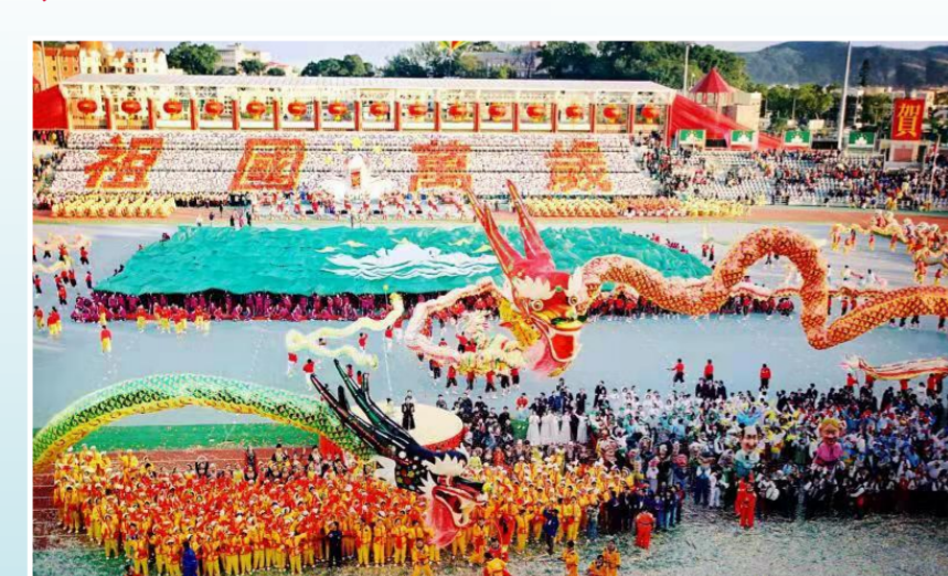
《回归之日》(1999年10月20日摄于澳门)