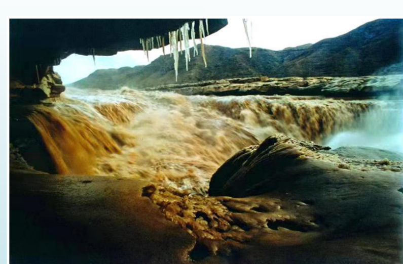
《千里黄河一壶收》(1986年12月25日摄于陕西)