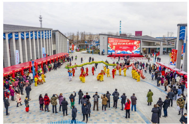
活动现场人山人海