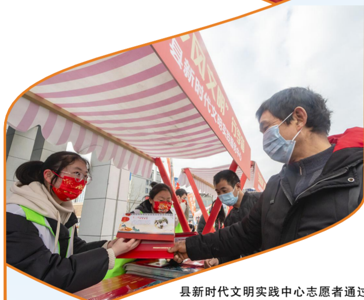
县新时代文明实践中心志愿者通过台历画向市民宣传创建全国文明城市知识