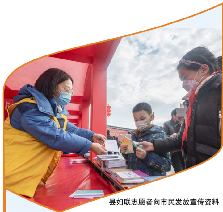
县妇联志愿者向市民发放宣传资料

【编者按】为全面贯彻落实市委部署要求,满足广大人民群众不断增长的精神文化需求,1月21日下午,由县委宣传部主办、黄沙港镇和射阳县旅投集团承办的全县“三下乡”“赶大集”志愿服务活动在黄沙港镇治心广场隆重举行。由29家单位组成的10支新时代文明实践志愿服务分队近百人,齐聚治心广场,热情开展志愿服务。活动现场还精彩展示了极具射阳特色文创产品、地方特色农副产品等展品,开展了黄沙港年货赶大集活动,展示区、服务区、演出区、黄沙港年货大集等4个区域人头攒动,广大市民欣赏文艺演出,享受志愿服务,购买各类年货。现撷取活动部分图片展示给大家,以飨读者。