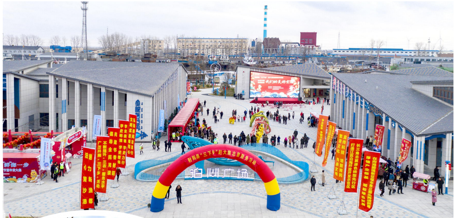
“三下乡”赶大集志愿服务活动现场