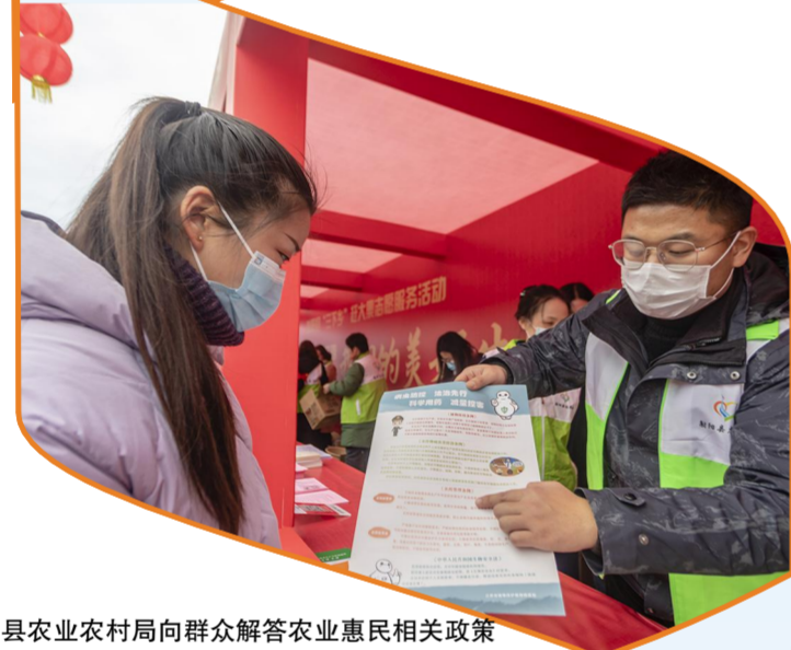
县农业农村局向群众解答农业惠民相关政策