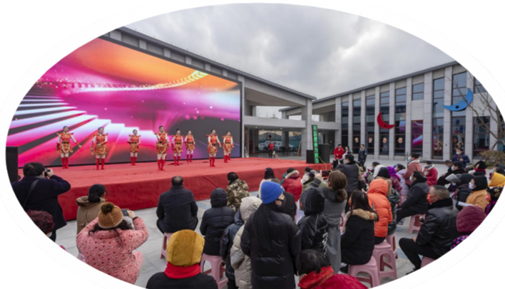
精彩纷呈的文艺表演