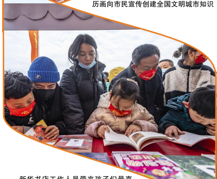
新华书店工作人员带来孩子们最喜欢的故事书