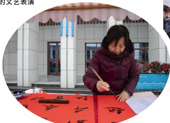
县文联组织书法家现场“泼墨”