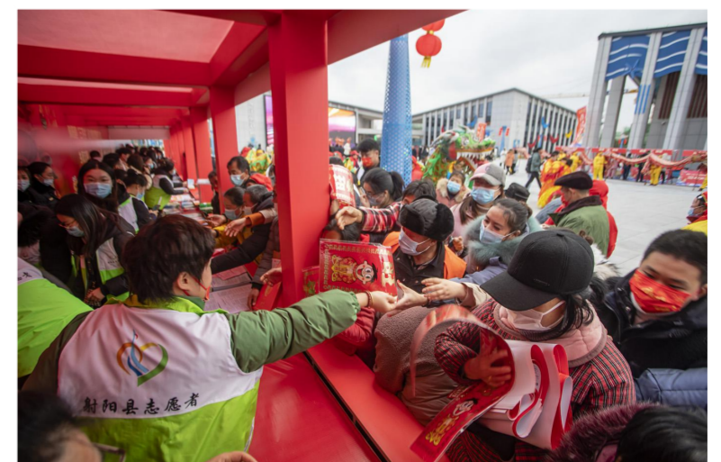
志愿者向市民发放春联