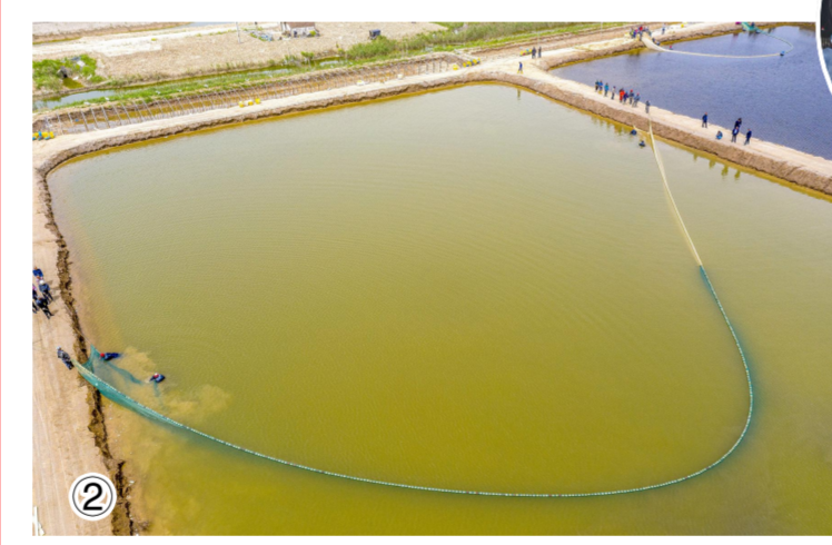
图1 我县蟹苗总产量约占全国70%,今年挂笼(育苗池)面积达1.32万亩。 图2 养殖户在进行抄苗作业。 图3 工作人员将蟹苗从淡化池中打捞出水。 图4 按照防疫规定将蟹苗清点装车。