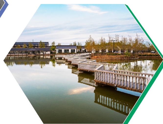
黄沙港生态园曲桥