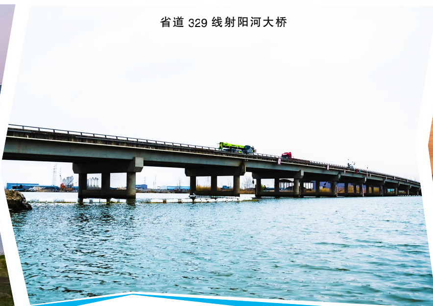
省道 329 线射阳河大桥