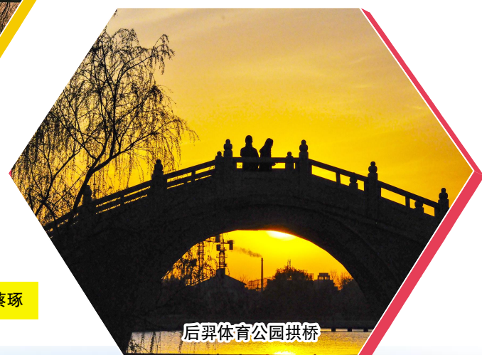
后羿体育公园拱桥